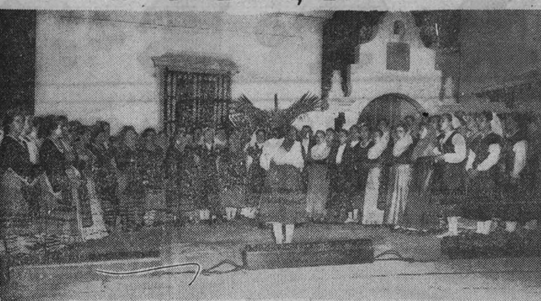
Nuestras camaradas de los Coros y Danzas de la Sección Femenina, en un momento de su actuación durante la fiesta que los fue ofrecida por el general norteamericano Sibert en San Juan de Puerto Rico, y en la que también triunfaron