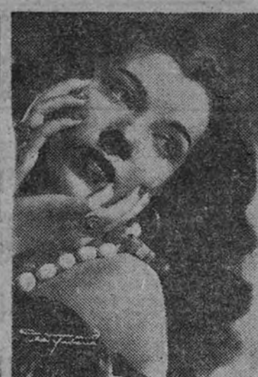
Rosita Segovia, maravillosa intérprete de las más famosas danzas, que el próximo jueves, a las once de la noche, se presentará en el teatro Gran Vía, y al frente del magnífico espectáculo "Sinfonía 2.000"

BARCELONA.—Se ha celebrado la inauguración de una nueva Residencia para estudiantes universitarios. Asistieron al acto el obispo de la diócesis, Gobernador Civil accidental y otras personalidades. (Cifra.)