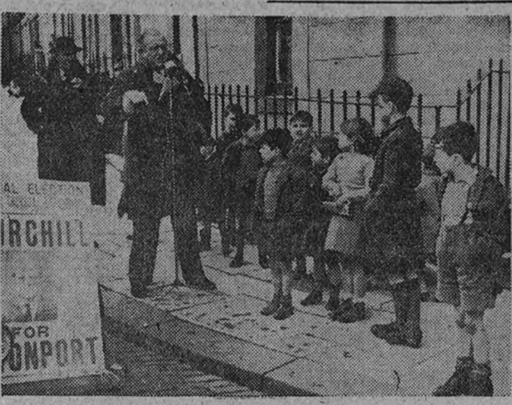
Randolph Churchill, hijo del jefe conservador inglés y candidato del mismo partido por Devonport, hace su propaganda electoral recorriendo en la vía pública. La oratoria del hijo del "ex premier" ha tenido escaso éxito, ya que no ha resultado elegido.