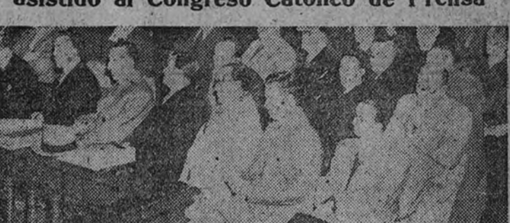
Los periodistas pertenecientes a la Delegación española durante una de las sesiones del Congreso Internacional de Prensa Católica

Dos representantes españoles figuran desde ahora en los organismos internacionales de Prensa Católica Regresan de Italia varios delegados que han asistido al Congreso Católico de Prensa