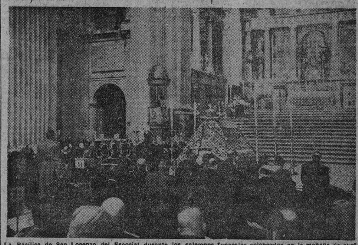
La Basílica de San Lorenzo del Escorial durante los solemnes funerales celebrados en la mañana de ayer, presididos por Su Excelencia el Jefe del Estado y aplicados a la memoria del Rey Don Alfonso XIII.

El Jefe del Estado fué aclamado por la multitud