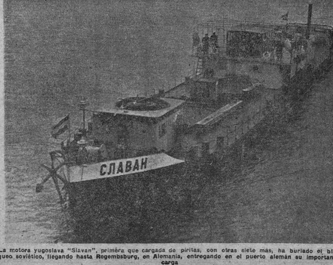
La motora yugoslava "Slavan", primera que cargada de piratas, con otras siete más, ha burlado el bloqueo soviético, llegando hasta Regensburg, en Alemania, entregando en el puerto alemán su importante carga.

Las próximas negociaciones se celebrarán en territorio alemán para desearlo así las autoridades alemanas.