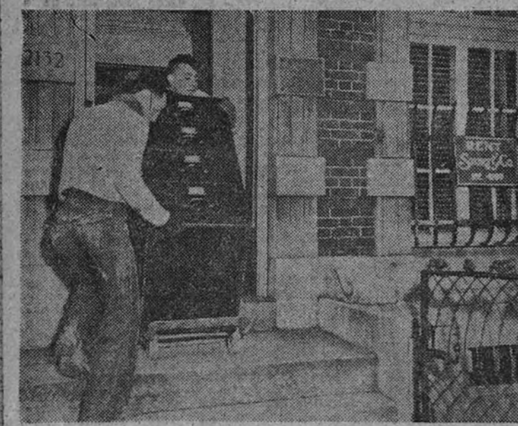
Dos obreros de una casa de mudanzas proceden a trasladar los muebles y enseres del edificio de la Legación búlgara, que por la ruptura de relaciones ostenta ahora el cartel de "Se alquila".