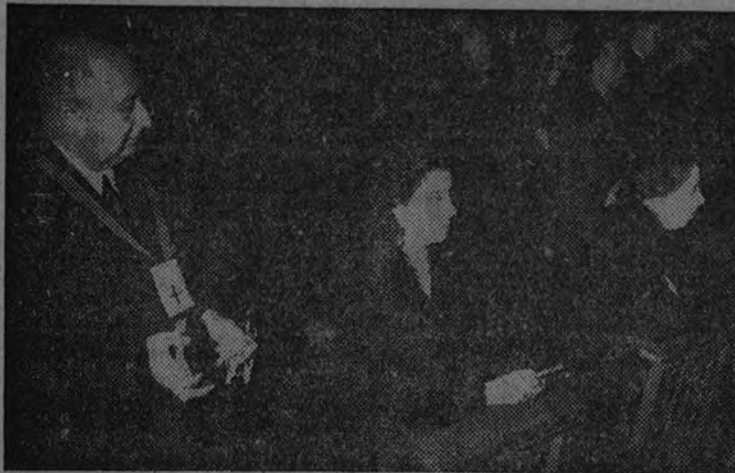
Doña Carmen Polo de Franco oyendo misa en la iglesia de Jesús ayer, primer viernes de marzo, siguiendo la tradicional devoción del pueblo madrileño por la milagrosa imagen

Doña Carmen Polo de Franco y varios Ministros figuraron entre los millares de devotos que se postraron a los pies del Nazareno