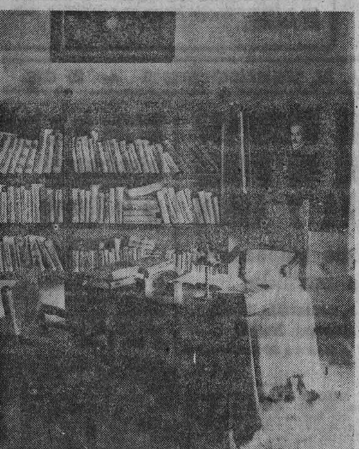
Terminadas las obras de ampliación de la Casa de Lope de Vega (calle de Cervantes, número 11), puesta bajo el Patronato de la Real Academia Española, queda abierta al público dicha Casa, que podrá visitarse todos los días, de once a dos, salvo los lunes. El ambiente que allí se respira, evocar en alto grado de la figura de Lope, y de su época, deja en el ánimo una impresión inolvidable. (En la fotografía, un aspecto del estudio del Fenix)

LA CASA DE LOPE DE VEGA, ABIERTA AL PÚBLICO