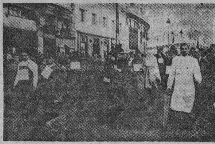
El cortejo universitario que ayer recorrió las calles de Madrid para anunciar las fiestas de Santo Tomás de Aquino, Patrono de los estudiantes.—El Ministro y Secretario General del Movimiento, camarada Raimundo Fernández-Cuesta, recibió ayer a los universitarios madrileños que recorrieron las calles de nuestra capital, ataviados con trajes alegóricos a las diversas actividades y a los centros docentes a que pertenecían, para anunciar las fiestas del Patrono de los estudiantes, Santo Tomás de Aquino.

El doctor conferenciante fue muy aplaudido y felicitado por la distinguida concurrencia que llenaba el salón.