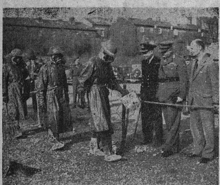
Aquí tienen ustedes a algunos de los "penitentes" que figuraron en la reciente "semana atómica", que con gran esplendor se ha celebrado en Inglaterra. Por primera vez han sido utilizados detectores especiales contra la radioactividad.