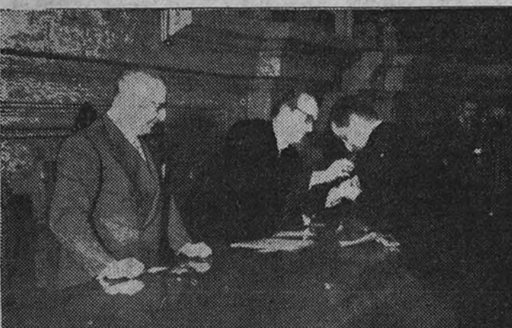
Los Ministros de Educación Nacional e Industria durante la entrega de títulos e insignias a los nuevos ingenieros de Minas.

Presidieron el acto los Ministros de Educación e Industria