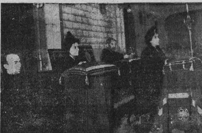
La esposa del Caudillo, acompañada de la condesa de Marín, del padre provincial de Castilla de la Orden Hospitalaria de San Juan de Dios y del padre director del Asilo de San Rafael, durante los actos celebrados en aquel centro benéfico para conmemorar el IV centenario de la muerte de San Juan de Dios.

Se celebraron en el Asilo de San Rafael, con asistencia de la esposa del Caudillo y el arzobispo de Burgos