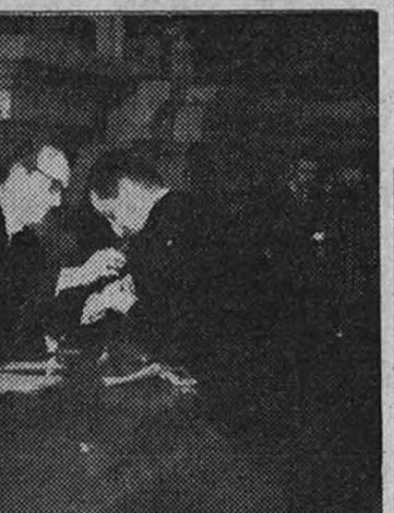
Los Ministros de Educación Nacional e Industria durante la entrega de títulos e insignias a los nuevos ingenieros de Minas.

Presidieron el acto los Ministros de Educación e Industria