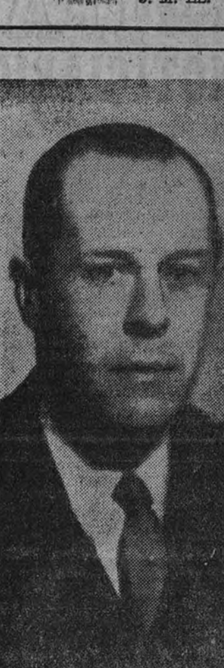
admira tanto entre los argentinos de esta madre Patria.

De allí, de Paraná, de su Colegio nacional, salieron y salen generaciones de argentinos que fueron y son esforzados paladines en