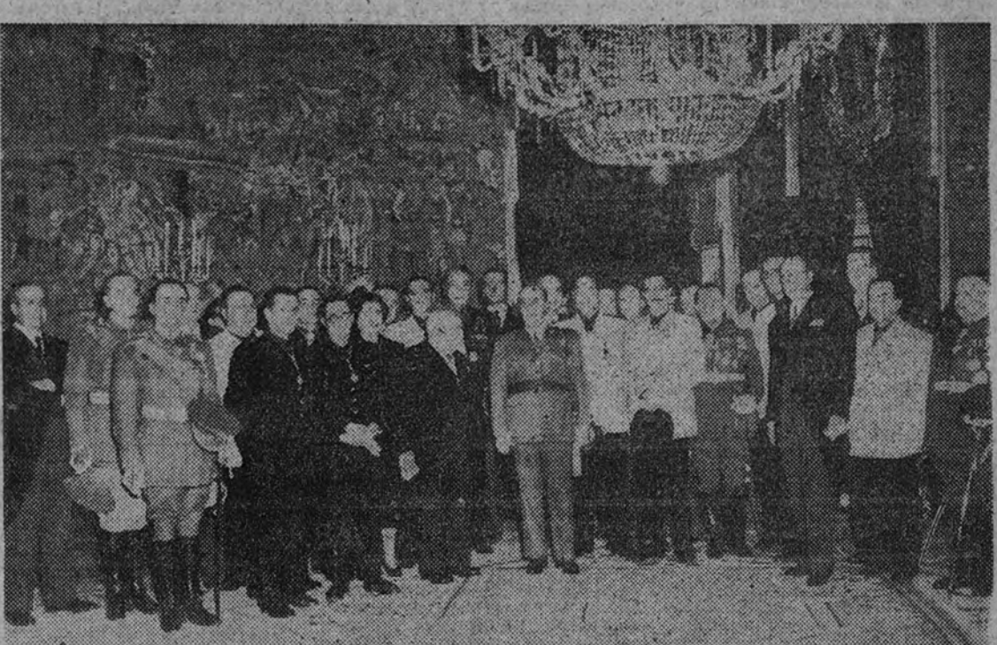
El Caudillo con los miembros del Consejo del Instituto Nacional de Previsión, a los que recibió ayer en el palacio de El Pardo (Foto Contreras.)

ROMA. — Han comenzado en aguas del mar Tiro en las más importantes maniobras aeronavales italianas celebradas después de la guerra. Participan en los ejercicios el acorazado "Doria", una escuadrilla de contratorpederos, dos de torpederos y varias escuadrillas de aviones. (Efe.)