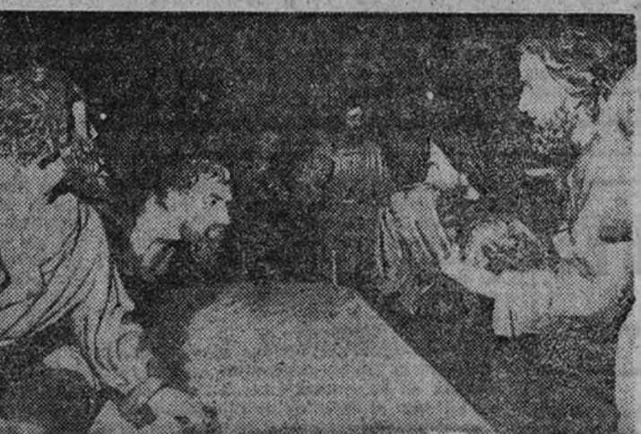
Un detalle de la impresionante obra artística de Víctor de los Ríos

EN los salones de la Dirección General de Bellas Artes y Colonias ha tenido lugar, a mediación de ayer, la inauguración de un notable grupo escultórico, representando la Sagrada Cena, realización de Víctor de los Ríos para la Semana Santa de León.