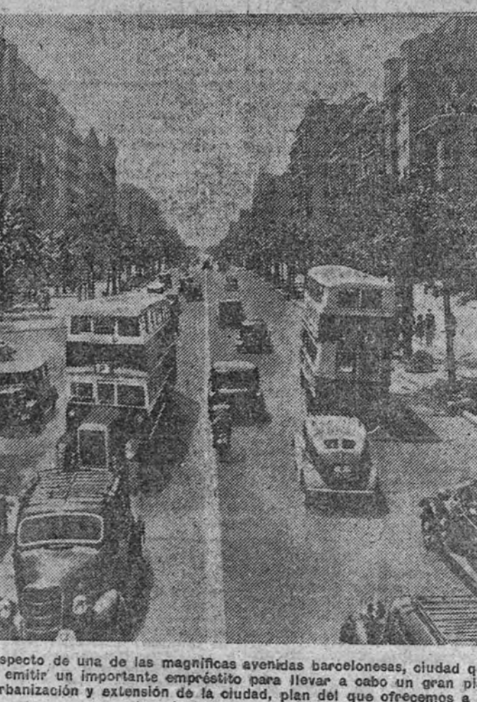
Aspecto de una de las magníficas avenidas barcelonesas, ciudad que va a emitir un importante empréstito para llevar a cabo un gran plan de urbanización y extensión de la ciudad, plan del que ofrecemos a nuestros lectores amplia información