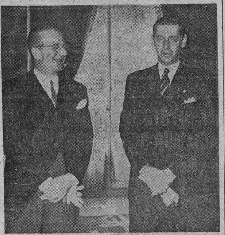
El príncipe Nicolás de Rumania, acompañado del marqués del Prat, momentos después de ser recibido por Su Excelencia el Jefe del Estado en el palacio de El Pardo

Audiencias militar y civil de S. E. el Jefe del Estado