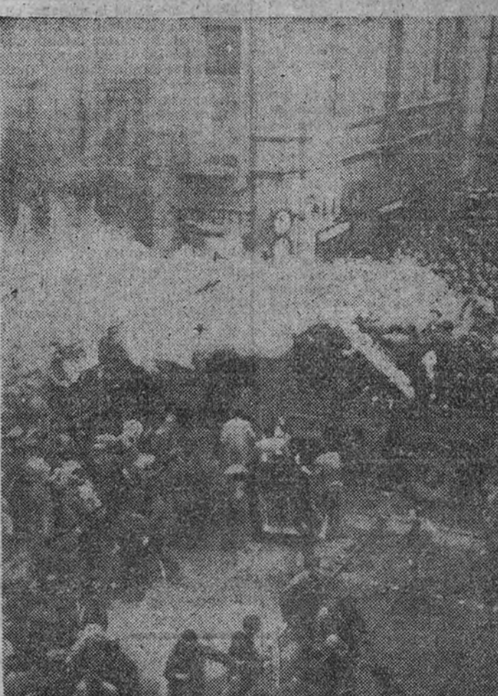
Elementos sindicales comunistas atacan con bombas de humo a la Policía en el transcurso de los incidentes promovidos con ocasión de la huelga general decretada por los Sindicatos marxistas

La Santa Sede apoya la internacionalización de Jerusalén ROMA. — En los círculos vaticanos se afirma que la Santa Sede sigue apoyando la tesis de la internacionalización sobre la que continúa trabajando la Comisión especial de la O. N. U. Esta Comisión ha rechazado anteriormente el proyecto Carreau. (Efe.)