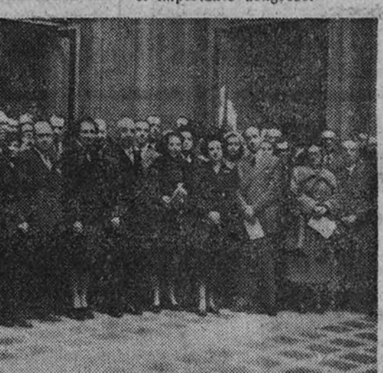
La recepción en el Ayuntamiento

Y, por último, se discutieron y aprobaron unas conclusiones correspondientes a las industrias de la Seda, de la Corveza, del Vinagre y del Fomento, quedando ultimado lo correspondiente a este subgrupo.