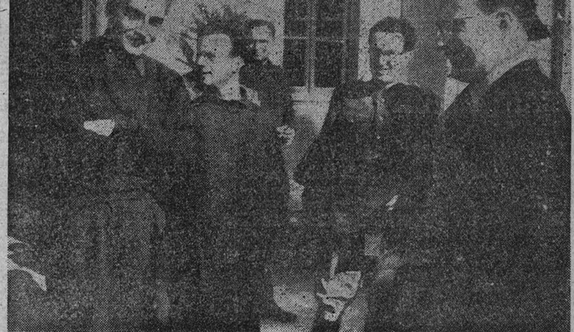
José Antonio Elola, Delegado Nacional del Frente de Juventudes, acompañado del Secretario Nacional y otras jerarquías que asisten al Congreso que se celebra actualmente en Arenys de Mar

Los temas que afectan a las Falanges Juveniles fueron objeto de especial atención