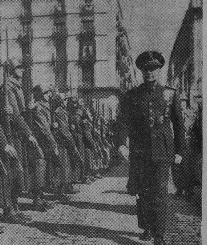
El Secretario General del Movimiento y Ministro de Justicia, camarada Raimundo Fernández-Cuesta, revisa a las tropas que le rindieron honores a su llegada al Ayuntamiento de Barcelona

Debeis, pues, prepararos para tomar parte en la vida de España, y en la vida de todos los españoles, física, intelectual y moralmente, para llevar con todo el ímpetu de vuestra juventud incontaminada y con la ilusión de vuestras almas, a la construcción de la España nueva, a la construcción de la España nueva, a la construcción de la España nueva.