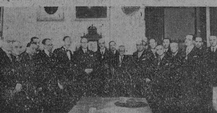
El Ministro de Educación Nacional acompañado del nuevo académico y personalidades que asistieron al acto

Le impuso la medalla el señor Ministro de Educación Nacional