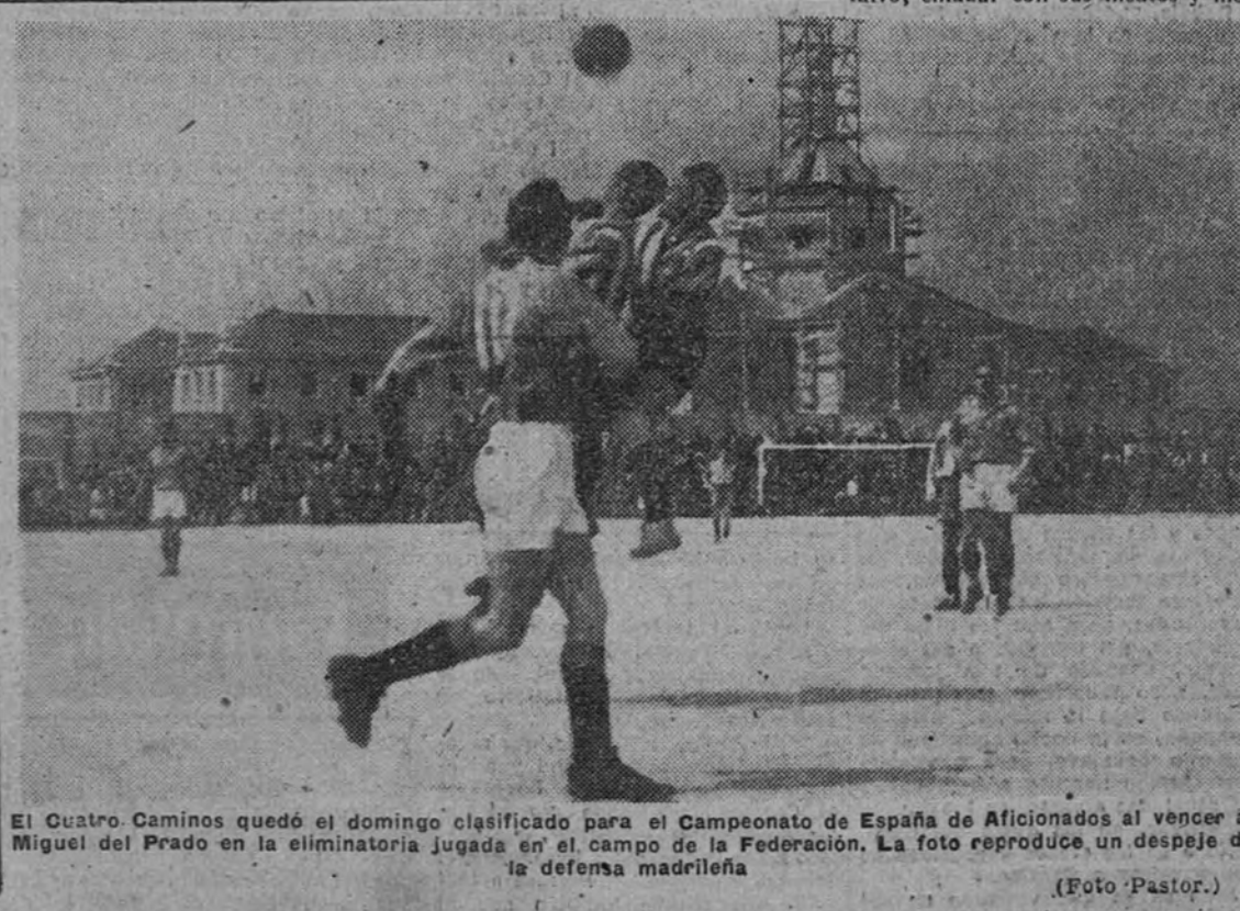
El Cuatro Caminos quedó el domingo clasificado para el Campeonato de España de Aficionados al vencer al Miguel del Prado en la eliminatoria jugada en el campo de la Federación. La foto reproduce un despegue de la defensa madrileña.