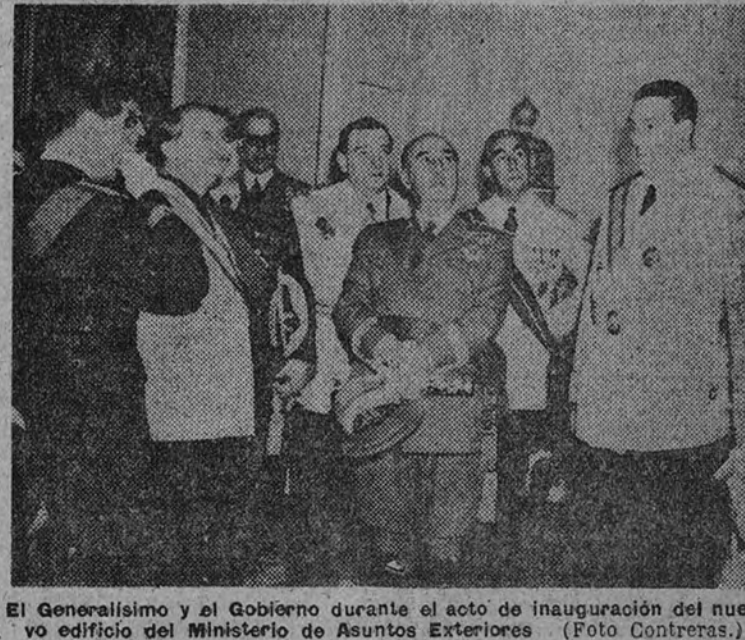
El Generalísimo y el Gobierno durante el acto de inauguración del nuevo edificio del Ministerio de Asuntos Exteriores.