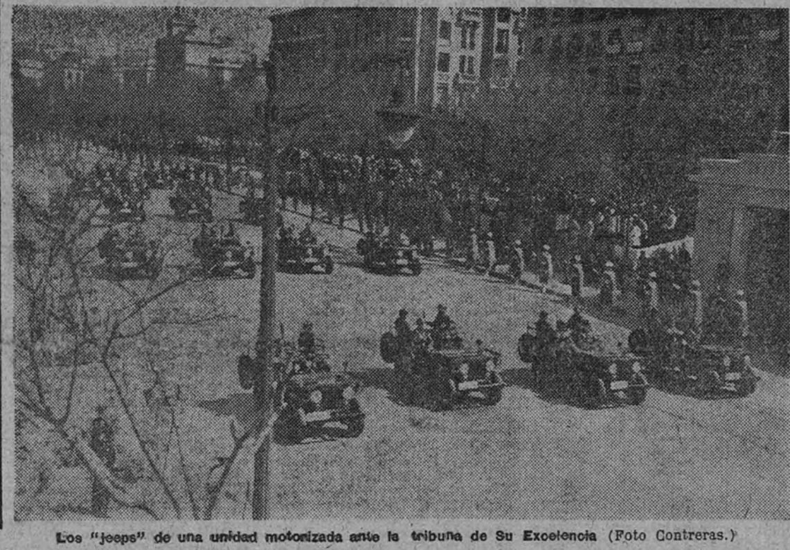
Los «jeeps» de una unidad motorizada ante la tribuna de Su Excelencia.