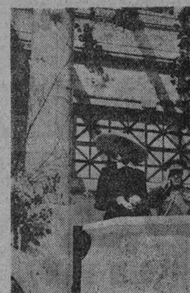
La esposa y la hija del Caudillo presenciando el desfile desde su tribuna

Toda España conmemoró ayer, con gran brillantez, la Fiesta de la Victoria. Se celebraron desfiles militares que fueron presenciados por los vecinos. Destacan los actos celebrados en Tetuán, Barcelona, Valencia y otras capitales. Todos los actos han estado presididos por las primeras autoridades.