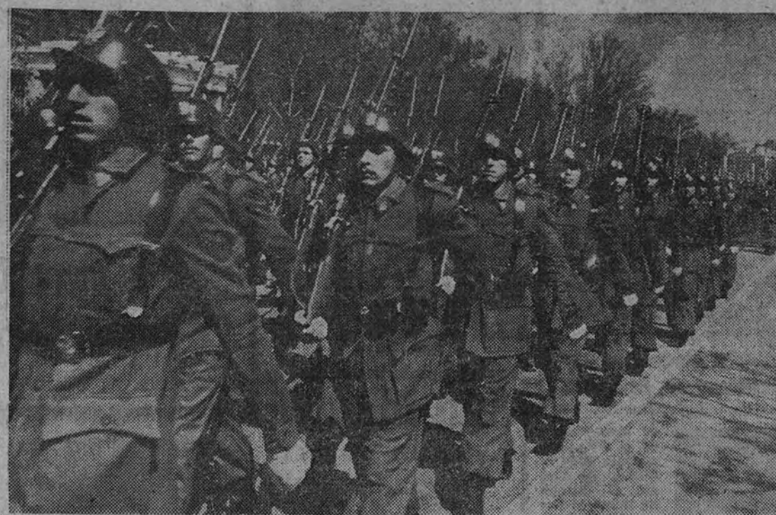
Fuerzas de Infantería en el XI desfile de la Victoria