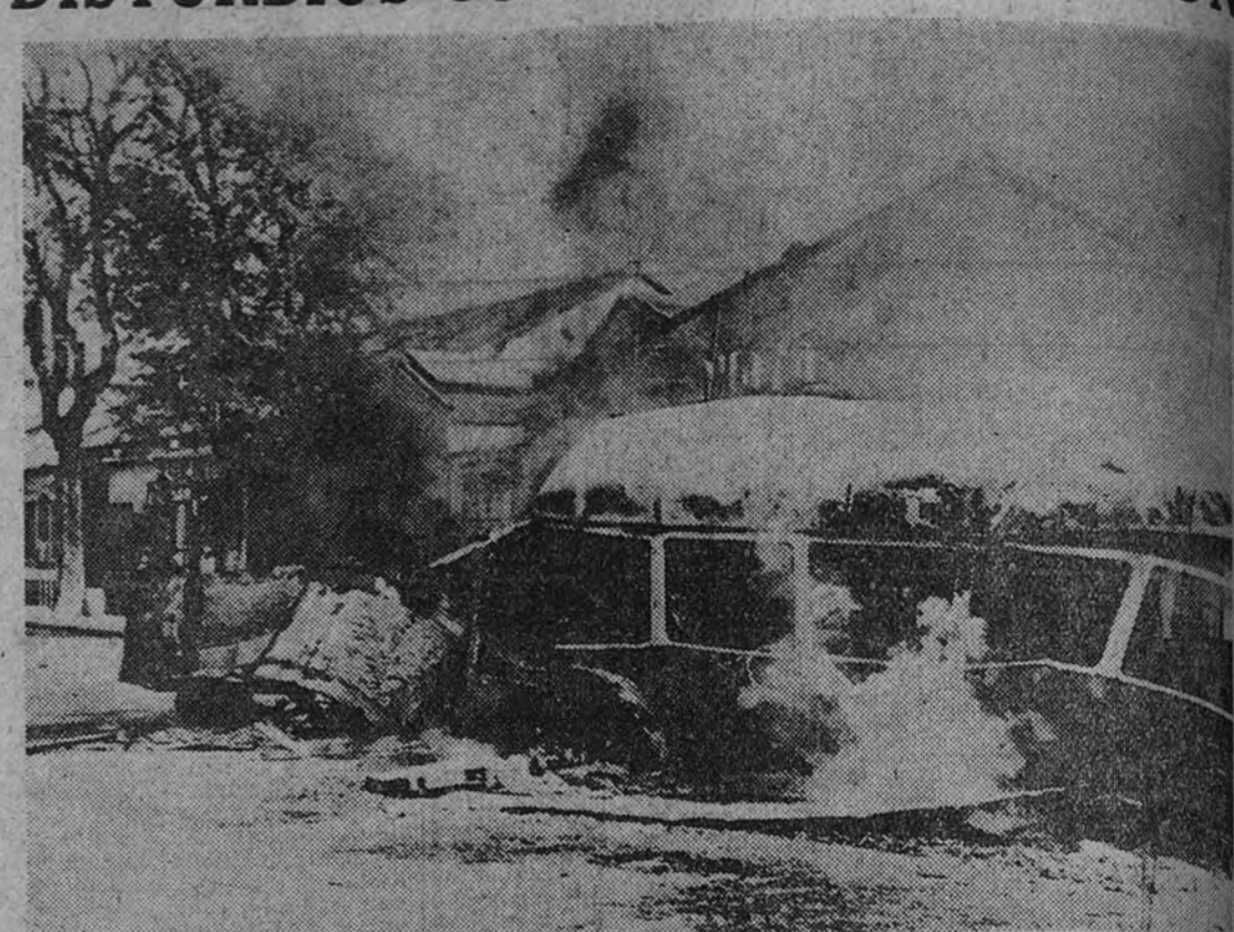
Como protesta por la llegada al puerto de dos destructores norteamericanos, los comunistas de Saigon provocaron grandes disturbios en la ciudad, que costaron la vida a dos personas, resultando heridas otras cuarenta. En una calle céntrica de la capital indochina, se pasto de las llamas este autobús, incendiado por los amigos de la U. R. S. S.