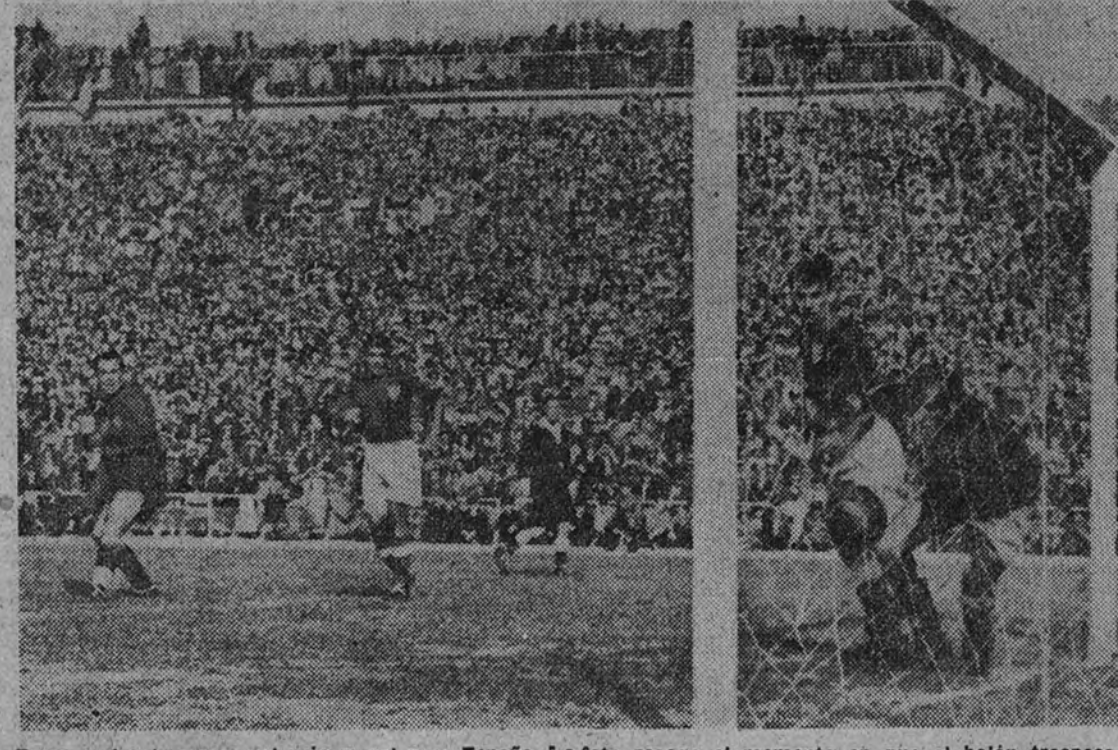
Zarra acaba de marcar el primer gol para España. La foto recoge el momento en que el balón traspasa la línea de la meta portuguesa, sin que Barrigana pueda hacer nada por impedirlo. Al fondo, el delantero centeo de la selección española mira con impaciencia la trayectoria de la pelota, que impulsada por su cabeza, se convertiría en el primer tanto de la tarde.