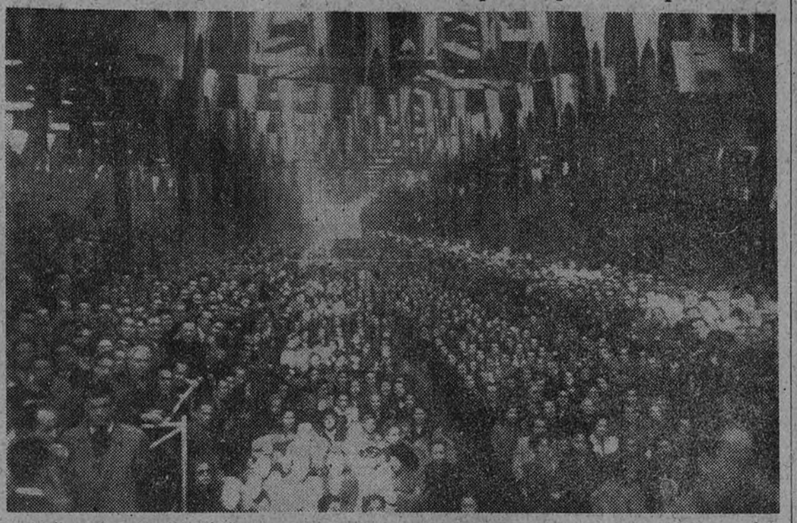
Doce mil productores ferroviarios se concentraron ayer en los talleres generales de la RENFE, para testimoniar al Caudillo su adhesión y gratitud por las mejoras que les han sido concedidas.

Las jerarquías sindicales, presididas por Sanz Orrío, les dieron cuenta de las mejoras sociales obtenidas