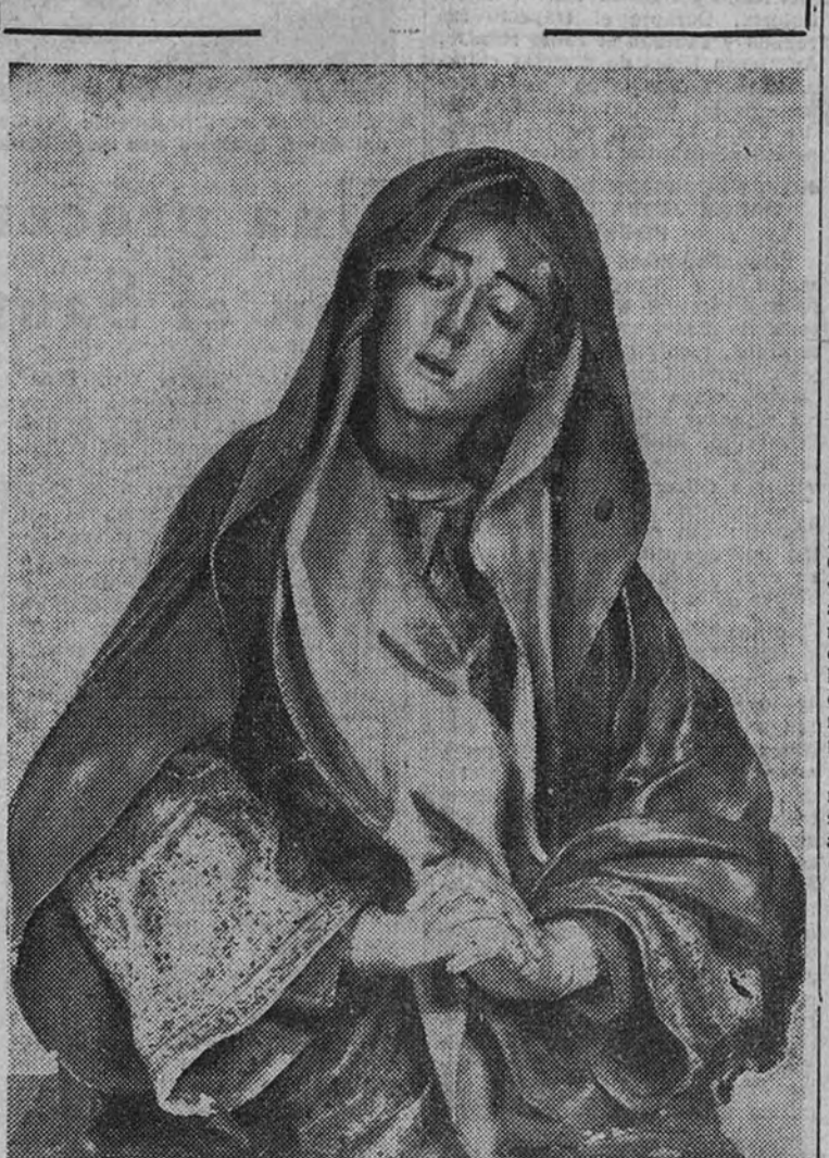
En el convento de las Descalzas Reales de Madrid se conserva esta imagen de Nuestra Señora, debida a las manos de Juan de Mesa.

Con esto, su mayoría en el Parlamento asciende a cuatro diputados LONDRES. — Ayer se celebró la elección parcial de Nepsend, en la que los laboristas han triunfado, tres diputados asistiendo a cuatro. La elección ha sido provocada por la renuncia del representante laborista del distrito, con el fin de que pudiera presentar su candidatura y lograr así el problema de la vivienda en su propio distrito en las elecciones generales. Los laboristas sacaron en estas 19.000 votos de mayoría en Nepsend. Pero, aun con el triunfo de Soskice, la mayoría laborista quedará por algún tiempo reducida prácticamente a tres votos, pues el diputado por Consett, James Glenville, ha tenido que ser hospitalizado.