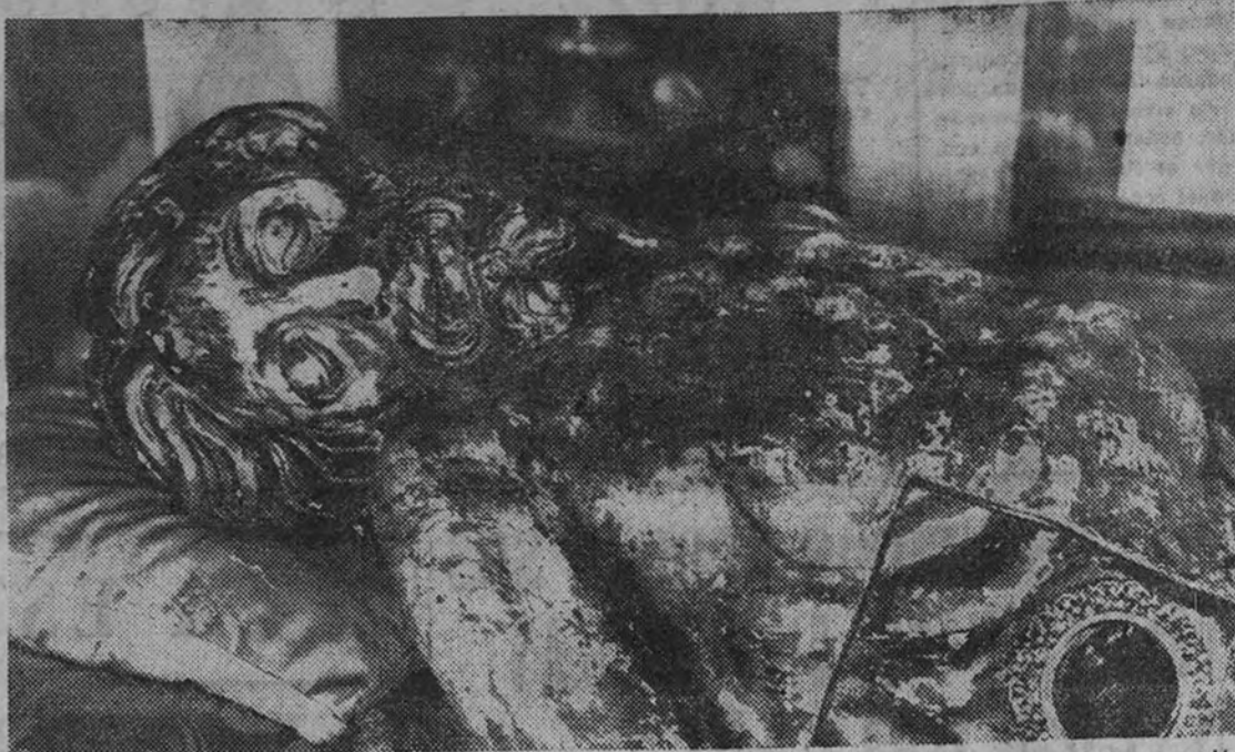
Detalle de la imagen yacente del Redentor, cuyo costado derecho sirve de sagrario durante la procesión del Santo Entierro que se celebra la tarde del Viernes Santo en el convento de las Descalzas Reales