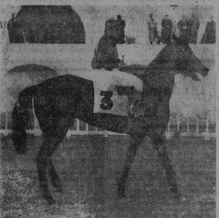
"Jolasetta" figura entre los favoritos en el Premio República Argentina, que esta tarde se correrá en el hipódromo de la Zarzuela.

El Premio República Argentina (25.000 pesetas, 1.600 metros), prueba principal de la cuarta reunión de carreras que esta tarde se celebra en la Zarzuela, reúne un lote de nueve participantes, de entre los que, a nuestro juicio, destaca "Faro" como probable ganador. El primer día de la temporada "Ion" batió a nuestro favorito por una corta cabeza, sobre 1.800 metros, pero recibiendo de él tres kilos, y hoy van a pesos iguales, por lo que es de suponer que el de Candarias se tome la revancha. También en aquella ocasión corrieron "Jai Churi" y "Adana II", y quince días más tarde el primero batía a la segunda, por lo que ésta debe de quedar eliminada por esta línea de comparación. "Tarasca" batió a "Macareo" en el Premio Przemysli (handicap) por seis cuerpos, y entre ellos se intercaló "Trébol", que hoy no corre, sobre la misma distancia que esta tarde van a correr, siendo la yegua la que entonces recibía siete kilos, y hoy solamente son dos; por esta razón debe estar "Macareo" delante de "Tarasca". "Marfil" ha corrido en una prueba civil-militar, en la que estuvo tercera, y "Moza" no ha actuado aún esta temporada. Nos queda "Jolasetta", que ha estado segunda en "Top Fil" en el Premio de la Diputación; hace quince días, y en donde corrió con otros elementos de los que hoy son sus rivales. La de la Yeguada Militar corrió bien, pero recibiendo kilos de todos, y hoy dará plomo, entre otros, a dos que son un año