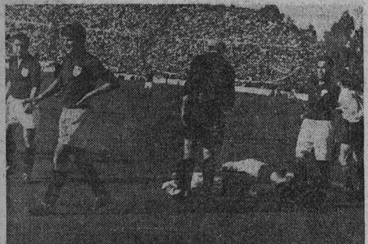
El juego de los portugueses fue duro, y buena prueba de ello son las lesiones que sufrieron nuestros jugadores. En la foto, Zarra y Panizo, que fueron de los más castigados, aparecen caídos en el suelo, mientras Gainza reclama al árbitro sancione la falta