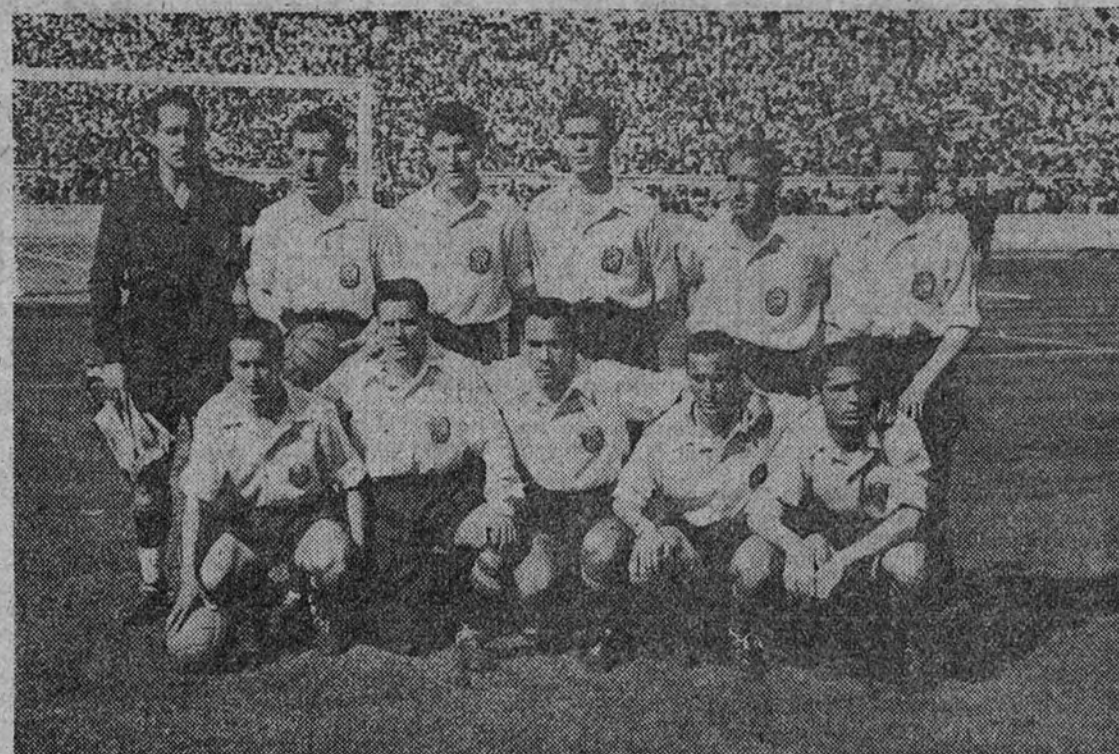
El equipo español que el domingo en Lisboa logró un meritorio empate con el portugués, clasificándose para las finales del Campeonato del mundo

Zarra: "Los portugueses realizaron juego muy duro, constantemente animados por el público,