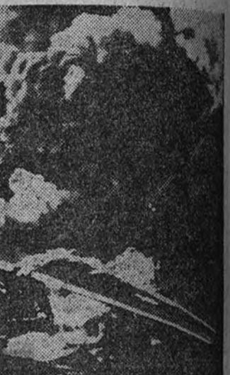
Un aspecto del gigantesco hidroavión norteamericano "Marshall" que el mayor del mundo—arriendo en aguas de Honolulu momentos después de caer al mar a causa de una avería en uno de sus motores. Todos sus tripulantes fueron rescatados sanos y salvos por varias labores de salvamento, pero la enorme aeronave resultó totalmente destruida por el fuego.

La fraternal reconciliación termina con rotura de vajilla y conclusiones