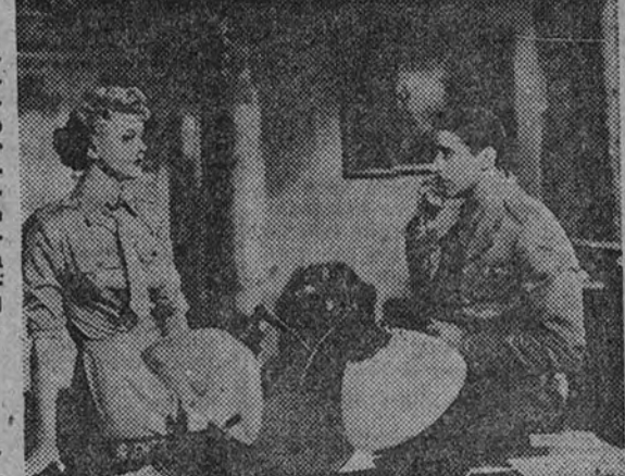
GOYA, BARCELO Y GONG

Angela Lansbury y Peter Lawford en la producción Metro Goldwyn Mayer "El Danubio Rojo", un auténtico y merecido éxito que alcanza su segunda semana de proyección en el Palacio de la Música