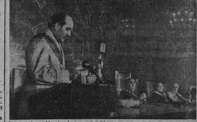
Durante la sesión de clausura del Pleno del Consejo de Investigaciones, el Ministro de Educación Nacional, señor Ibáñez Martín, pronunció un importante discurso, en el que informó de la labor de nuestro primer centro de investigaciones durante su primer decenio.