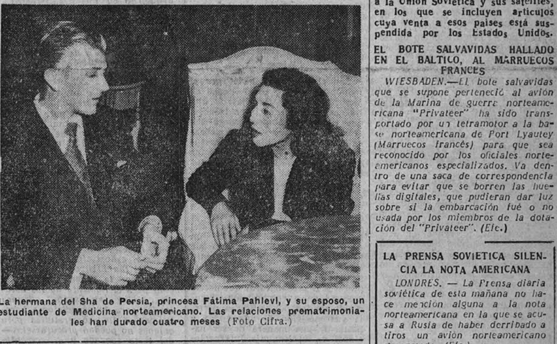
La hermana del Sha de Persia, princesa Fátima Pahlavi, y su esposo, un estudiante de Medicina norteamericano. Las relaciones prematrimoniales han durado cuatro meses.