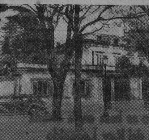
En la Oficina del Consejo Aliado de Control (Castellana, 1), tuvo lugar, ante el notario del Ilustre Colegio de Madrid don Luis Hernández González, el acto de otorgamiento de la escritura de compraventa de la finca que constituye el Palacio de la Embajada alemana, en el paseo de la Castellana, número 4. Respalda la operación, por un lado, la Comisión Interaliada (franceses, ingleses y norteamericanos), para la liquidación de los bienes que poseía en España el país vencido; por otro, la Sociedad Hidroeléctrica Española, que se propone construir en el lugar correspondiente (cerca de 70.000 pies) un edificio para sus oficinas. Aunque la demanda inicial se elevaba a 20 millones de pesetas, finalmente la Comisión Interaliada fijó la venta en 12 millones.

Aunque no existen noticias terminantes sobre los proyectos de la Sociedad Hidroeléctrica respecto a la nueva edificación, puede asegurarse que el área de la antigua Embajada de Alemania se incorporará a la serie de nuevas edificaciones que están transformando el aspecto del primer trazo de la Castellana, convertido de zona de palacios residenciales en núcleo de modernos edificios comerciales.