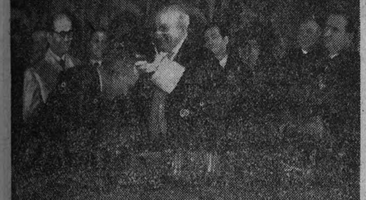
El rector de la Universidad impone las insignias de «doctor honoris causa» al profesor Waksman, ante el Ministro de Educación Nacional y decanos de las distintas Facultades

Le fueron impuestas las insignias, en acto presidido por el Ministro de Educación Nacional