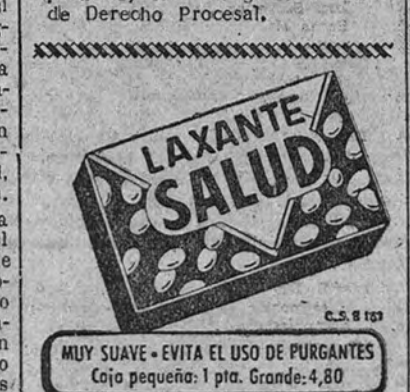
MUY SUAVE - EVITA EL USO DE PURGANTES Caja pequeña: 1 pta. Grande: 4,80

ORGANIZADO por el Instituto Español de Derecho Procesal, y bajo la presidencia del excelentísimo señor Ministro de Justicia, se va a celebrar en Madrid, durante los días 8 al 13 de mayo próximo, el I Congreso Nacional de Derecho Procesal.