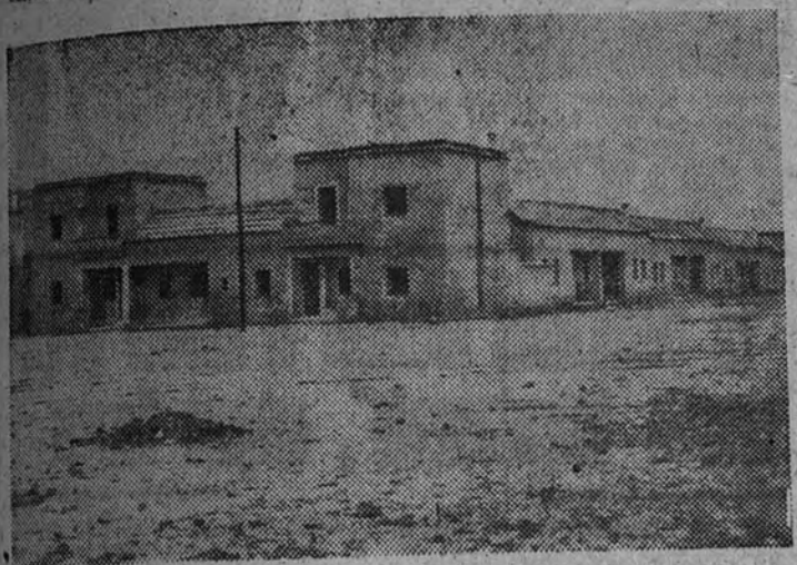
Construcciones en la zona del Ensanche

Casa de Socorro. Pero ninguna de todas estas cosas ni el conjunto de todas ellas pueden bastar para justificar la labor de este Ayuntamiento.