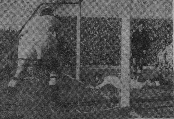
Apénas había transcurrido medio minuto de la segunda parte, cuando el Atlético se había apuntado su tercer gol, esta vez obra de Carlsón. Los jugadores valencianistas muestran su disgusto por la jugada del pequeño interior rojiblanco.