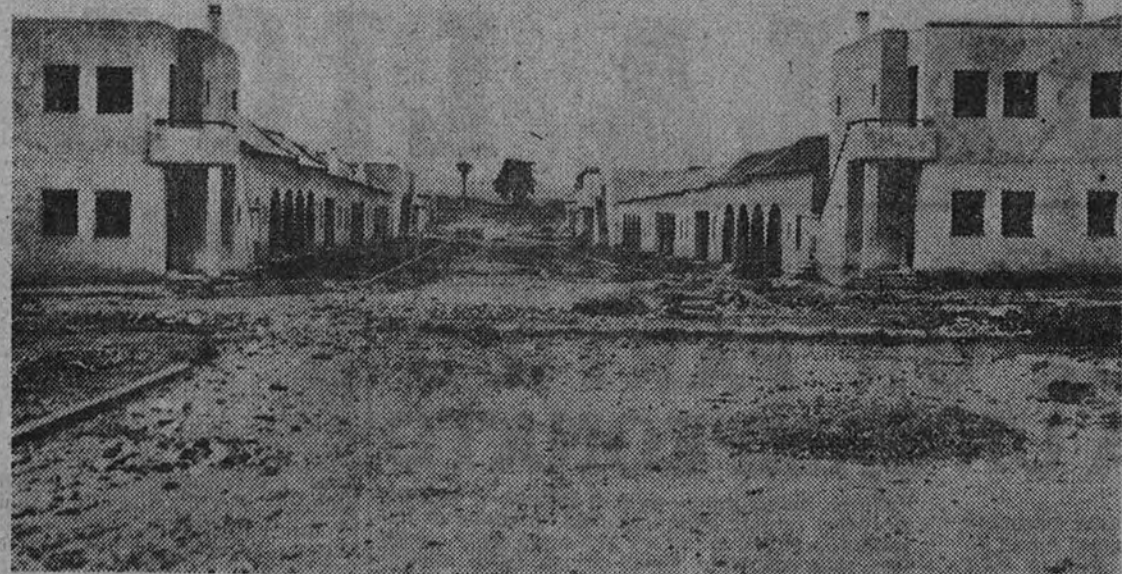
Un aspecto del grupo de viviendas "Cuatro Santos"

Una de las poblaciones españolas que más profundamente han reformado su anatomía urbana desde la Liberación hasta ahora ha sido Cartagena. El Ayuntamiento, desde los primeros momentos, tomó sobre sí la misión de embellecer y modernizar la ciudad, resolviendo problemas urbanísticos que anteriores Municipios habían limitado, en el silencio de los casos, a señalar.