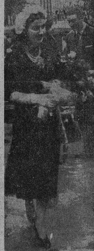
A su llegada a Tenerife, los marqueses de Villaverde son objeto de la expresión de simpatía por parte de la población.