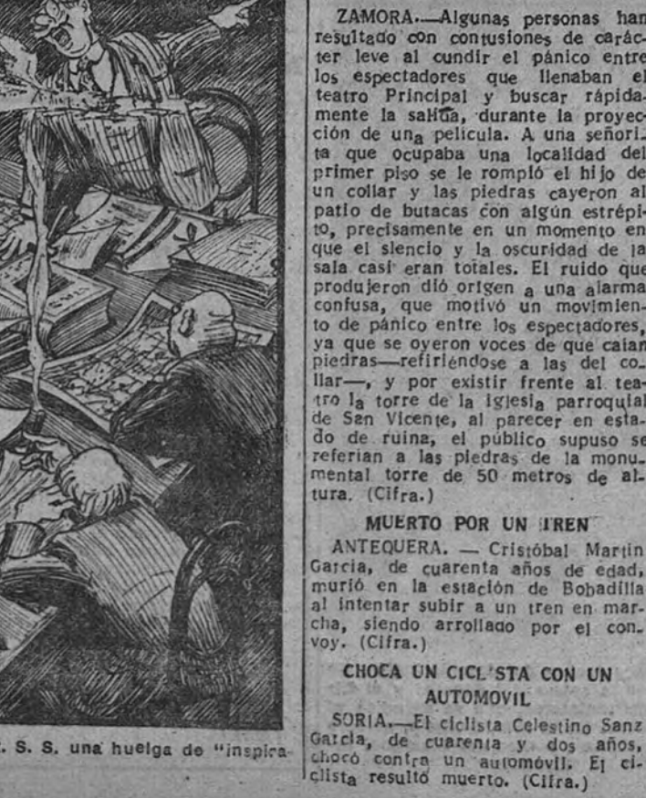
— Ya está! Organícenos en a U. R. S. S. una huelga de "inspiración democrática!"