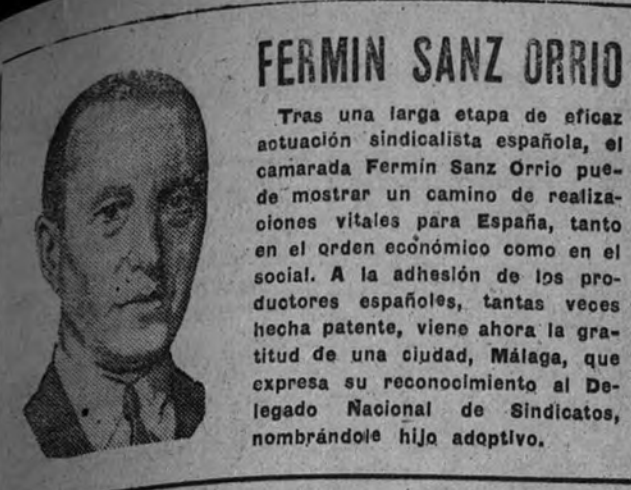
FERMIN SANZ ORRIO

Tras una larga etapa de eficaz actuación sindicalista española, el camarada Fermín Sanz Orrio puede mostrar un camino de realizaciones vitales para España, tanto en el orden económico como en el social. A la adhesión de los productores españoles, tantas veces hecha patente, viene ahora la gratitud de una ciudad, Málaga, que expresa su reconocimiento al Delegado Nacional de Sindicatos, nombrándole hijo adoptivo.