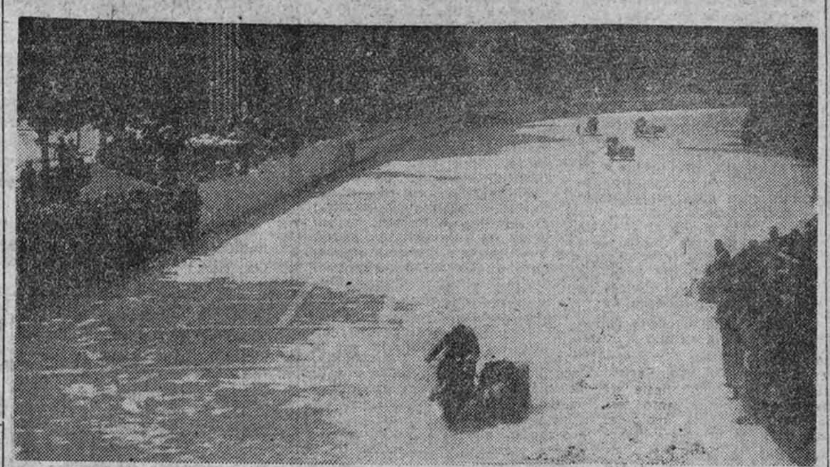
Los entrenamientos se celebrarán los días 11, 12 y 13 en el Retiro

La R. S. H. E. Club de Campo ha organizado un Campeonato social, que se disputará en las pistas de la Sociedad durante los días 4, 5 y 6 del actual, con objeto de preparar el Concurso Hípico Internacional, que empezará a disputarse en las mismas pistas a partir del día 13 del corriente.