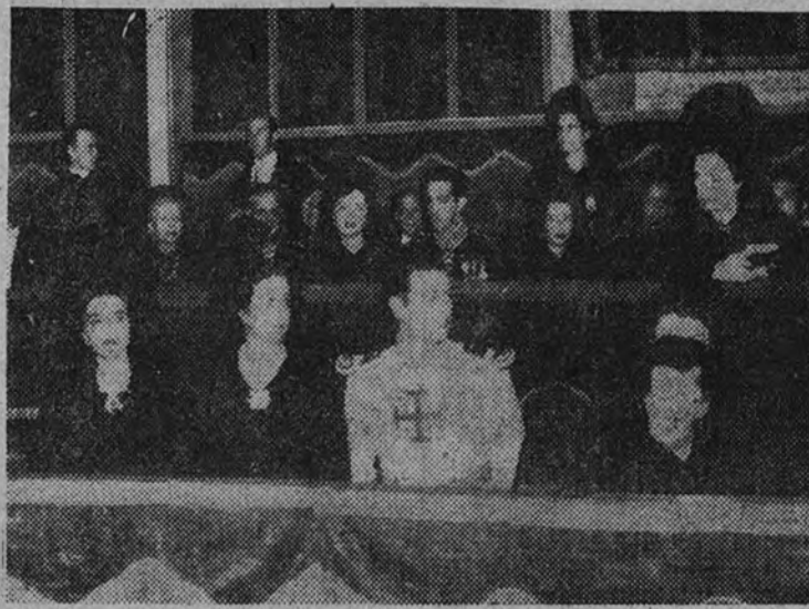
La esposa de Su Excelencia el Jefe del Estado español, acompañada de sus hijos, los marqueses de Villaverde, asiste en la Basílica de San Pedro, a la canonización del beato español Antonio María Claret

A las ocho menos diez de la mañana llegó a la basílica la esposa de Su Excelencia el Jefe del Estado español, acompañada del embajador, señor Ruiz Jiménez, y de sus hijos, los marqueses de Villaverde. La ilustre dama vestía traje negro, largo, con peineta y mantilla española, igual que su hijo. El marqués de Villaverde ostentaba el uniforme de caballero de la Orden del Santo Sepulcro. En otros automóviles seguían el jefe de la Casa Civil de Su Excelencia y la marquesa de Hueter de Santillán, así como los demás miembros del séquito y componentes de la Santa Sede.