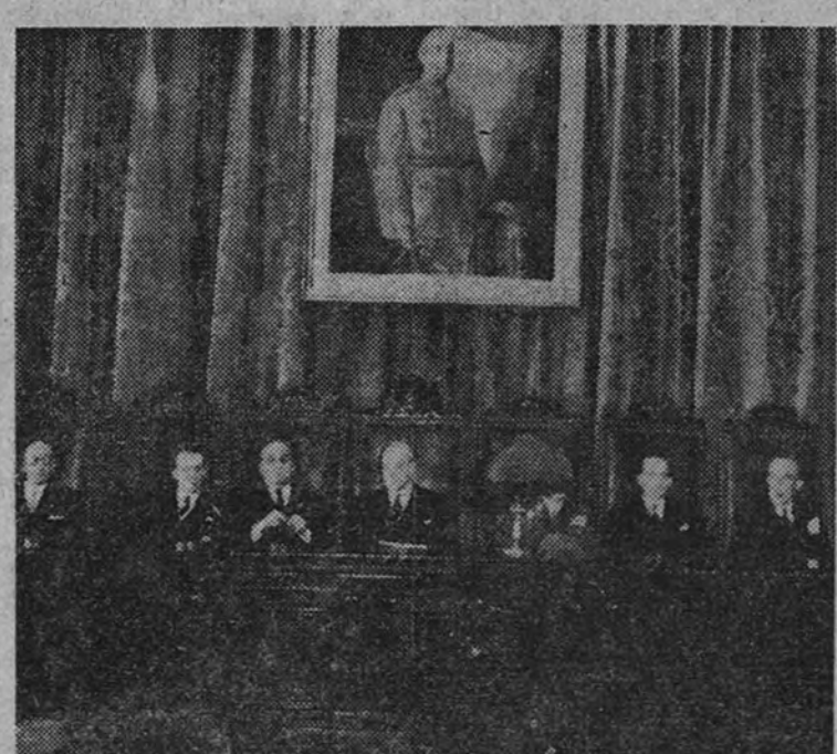
Presidencia de la sesión inaugural del I Congreso Nacional de Derecho Procesal, que se celebró en el Palacio de Justicia