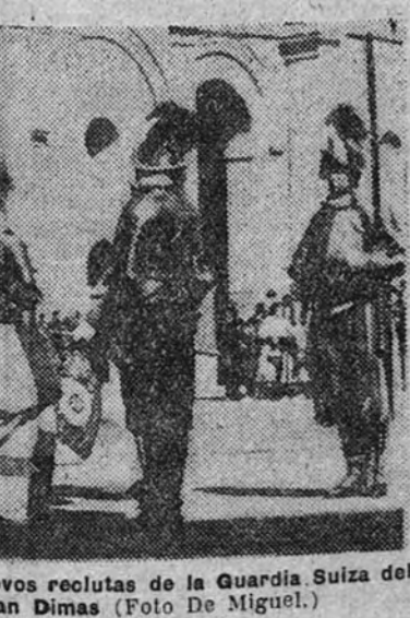
En el momento de la jura de los nuevos reclutas de la Guardia Suiza del Vaticano, en el patio de San Dámaso.