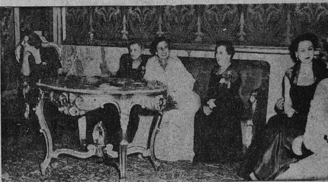
La esposa de Su Excelencia el Jefe del Estado, doña Carmen Polo de Franco, y sus hijos, los marqueses de Villaverde, durante la brillante recepción de gala celebrada en su honor en la Embajada de España en Roma.