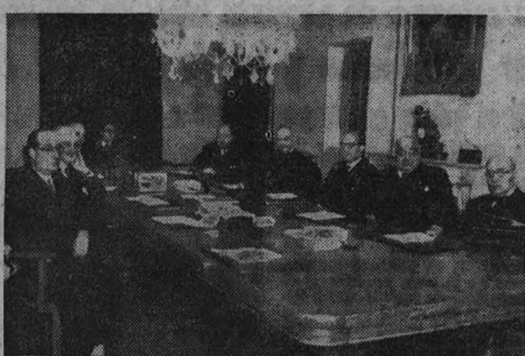
La Junta de gobierno del Instituto de España, reunida bajo la presidencia del señor Ministro de Educación Nacional.