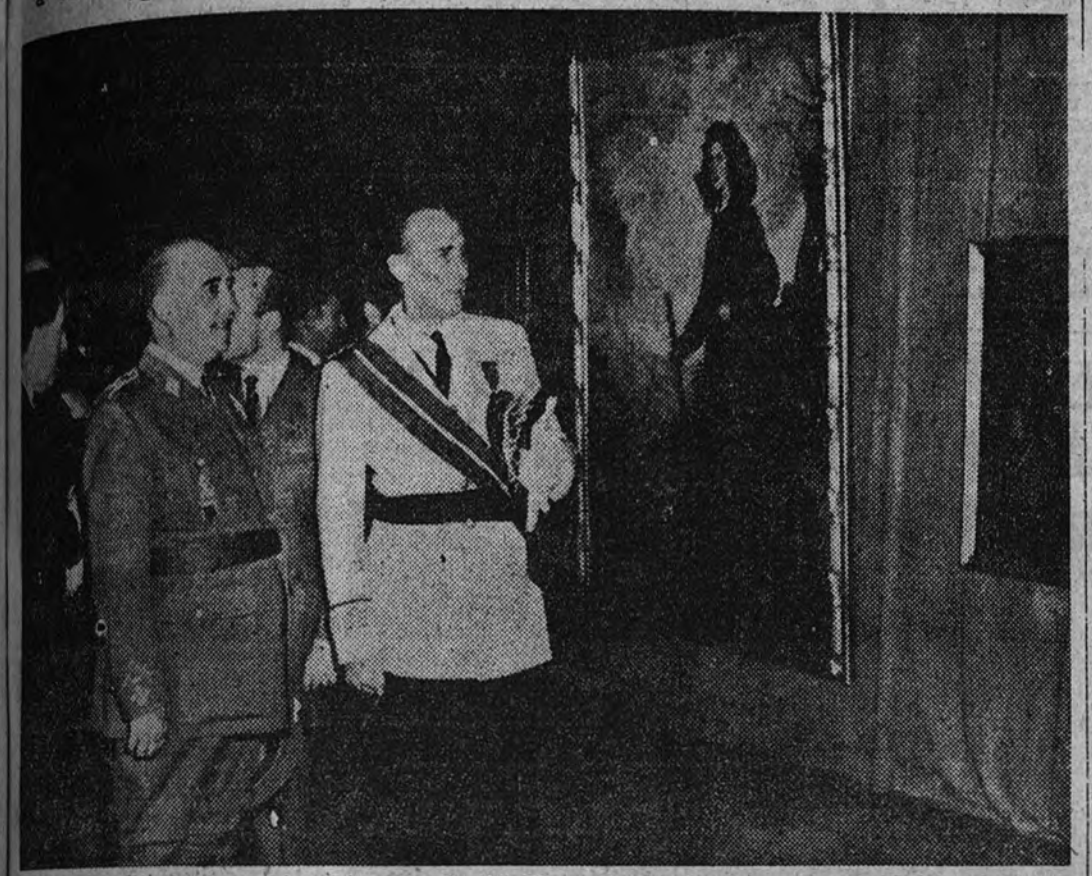
En la sala segunda, en la que se encuentran dos lienzos fundamentales, uno de Velázquez, que representa un cervo, y otro de Murillo, que representa la figura del conde de Legarda, secretario de Estado de Felipe IV. Estos cuadros, expuestos por primera vez, fueron muy admirados por el Caudillo.

Te acompañaban los Ministros de Agricultura, Educación y Justicia El Generalísimo, después de recorrer todas las salas, felicitó a los organizadores de este certamen