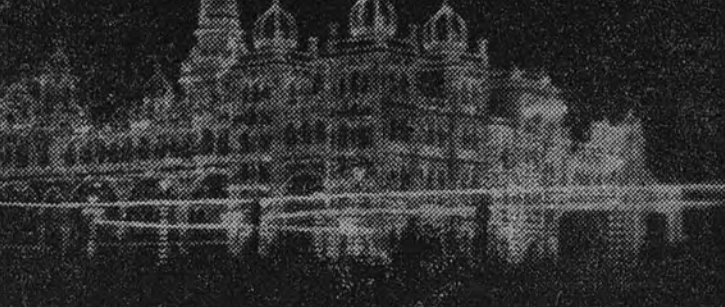
El palacio del Maharaja de Mysore, iluminado.

coniza la supresión de la propiedad privada, de la familia y del poder civil y religioso en la organización social, y la sustitución del régimen individual, jurídico y económico, por un régimen colectivo que entraña la producción en común, la atribución también en común de todos los bienes, y la absoluta igualdad en la repartición de los derechos y de los deberes sociales.