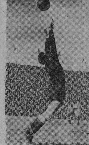
Una buena parada del portero del Madrid desvia a córner un peligroso tiro alto de la delantera atlética