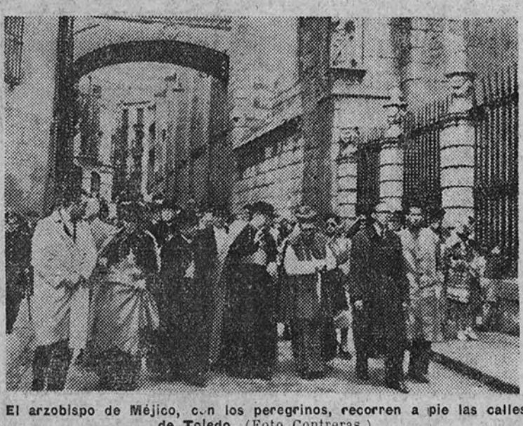
El arzobispo de Méjico, con los peregrinos, recorren a pie las calles de Toledo.