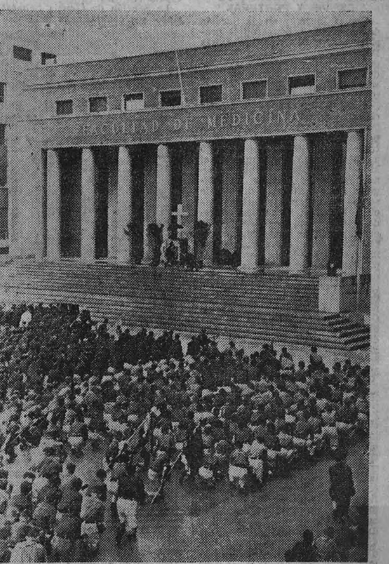
Un momento de la misa de campaña celebrada ayer por el Frente de Juventudes para conmemorar la fiesta de San Fernando en la Ciudad Universitaria.