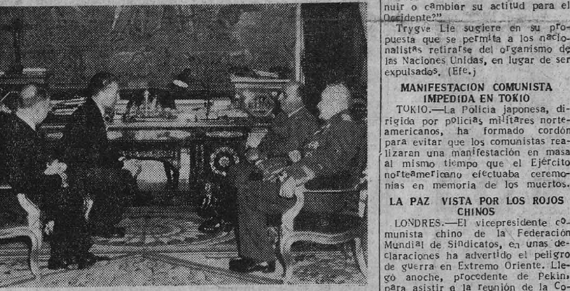
Su Excelencia el jefe del Estado recibió en la tarde de ayer, en el palacio de El Pardo, al ministro de Obras Públicas de Portugal, excelentísimo señor don José Federico Ulrich.

Más tarde cumplimentó al Ministro de Asuntos Exteriores en el palacio de Santa Cruz