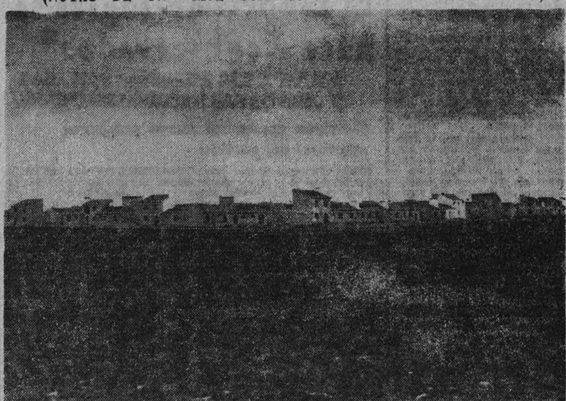
Vista general del nuevo pueblo de Valdelacalzada

Me ha dicho que Montijo es la mejor tierra de Extremadura, y aun, quizá, de España. Yo de esto entiendo bastante menos—con una diferencia comparable a la que existe entre la noche y el día—que don Carlos Morales. Es e don Carlos ha cumplido ya cuarenta y dos años de servicio en el Cuerpo de Ingenieros Agrónomos, y ahora está en el "generato" de su oficio.