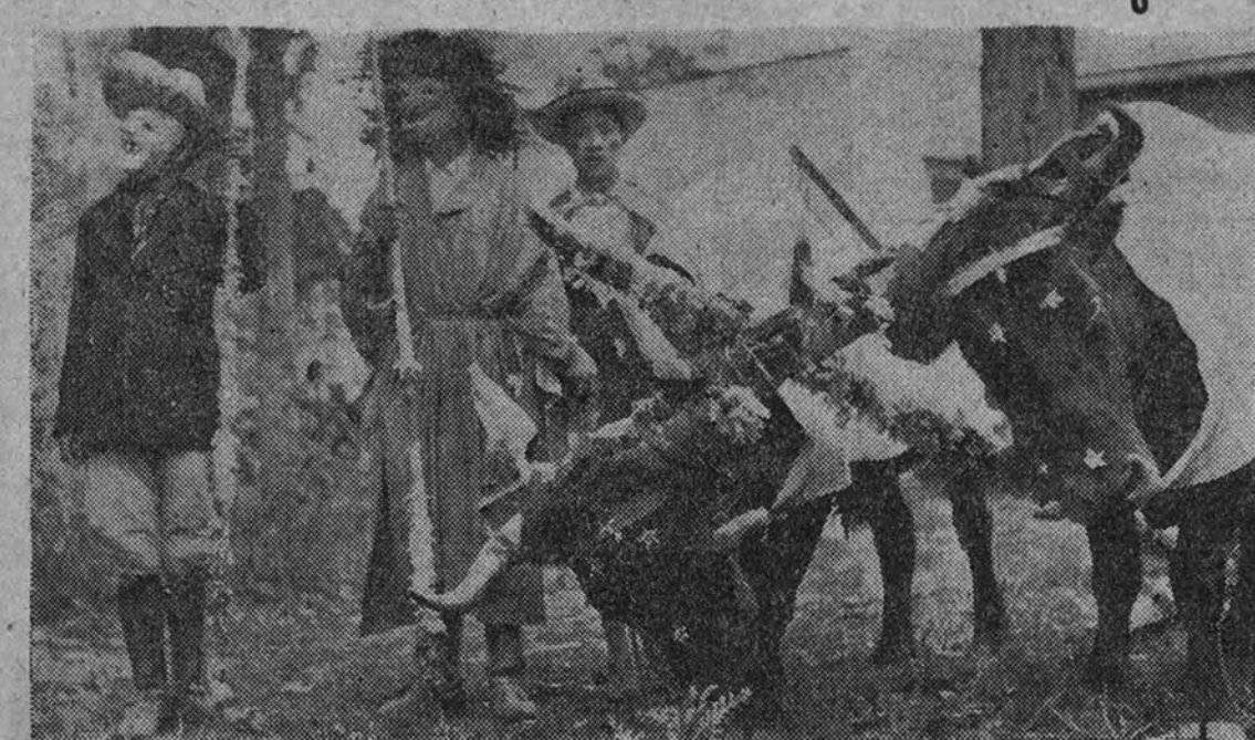
En el pueblo de Metepec (Estado de Méjico) se celebra la festividad de San Isidro Labrador el 31 de mayo. Los aborígenes le llaman el día de los "locos". Hay desfiles de máscaras, yuntas engalanadas, bailes típicos y ofrendas al Santo