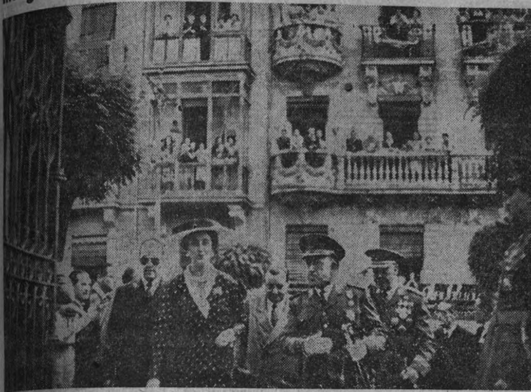
La esposa de Su Excelencia el Jefe del Estado, doña Carmen Polo de Franco, a su llegada a Granada, donde fue recibida por las autoridades y gran cantidad de público, que le dispuso un caluroso recibimiento.