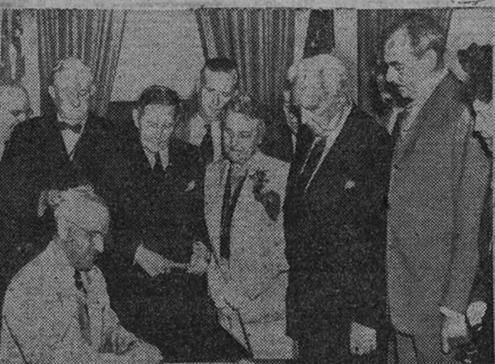
Haciendo gala de su mejor sonrisa, el presidente Truman realiza—mirando al público, como quien dice—una magistral faena de política exterior. La firma del Presidente vale en esta ocasión nada más que 3.248.450.000 dólares; cantidad que se convertirá en armas para Europa, ¡que sea para bien!, nivel Truman.