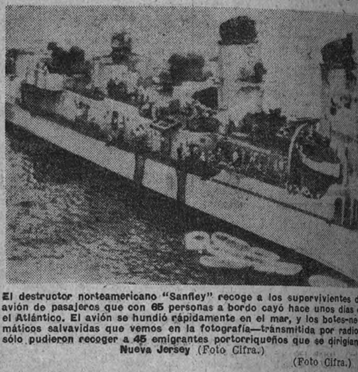
El destructor norteamericano "Sanley" recoge a los supervivientes del avión de pasajeros que con 95 personas a bordo cayó hace unos días en el Atlántico. El avión se hundió rápidamente en el mar, y los botes salvavidas que vimos en la fotografía — transmitida por radio — sólo pudieron recoger a 45 emigrantes portorriqueños que se dirigían a Nueva Jersey