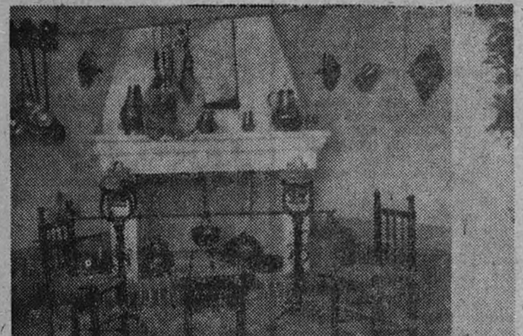
La cocina típica extremeña, maravillosamente ambientada, que figura en el pabellón de Cáceres

Nestlé ha obtenido el máximo galardón en la feria, medalla de oro, por sus cuatro productos siguientes: Leche condensada "La Lechera", leche acidificada "Pelargon", babeurre "Eledón" y harina lactada "Nestlé". Cuatro artículos de calidad conocidos en el mundo entero. Pero no es solamente por la bondad de sus productos por lo que ha destacado la aportación de Nestlé a la I Feria Nacional del Campo. Ha contribuido también la magnificencia de sus instalaciones. Ofrecemos a la consideración de nuestros lectores el magnífico camión de propaganda de la Sociedad Nestlé, para efectuar las degustaciones de sus acreditados productos leche condensada "La Lechera", "Nestlé", "Pelargon", "Eledón", "Arobón", "Nescafé", "Nestlé sin leche", "Nescafé" y "Nestrovit".