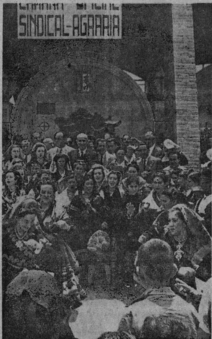
Exhibición folclórica ante el pabellón cacerreño

En ella, en lo que puramente se trata de pabellón se exhibe con el adorno de los gráficos y los motivos, vellejos, cueros, quesos, jamones, longanizas y otros productos típicos derivados de la ganadería, que representa una de las principales fuentes de riqueza de la provincia. Es, en realidad, la ganadería la piedra angular de la economía extremeña, pero siempre en íntima relación con la