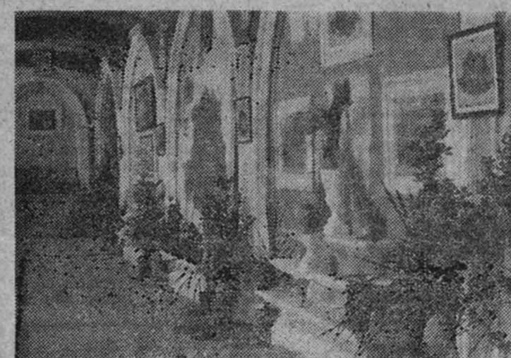
Una vista general del pabellón de Cáceres en la Feria del Campo