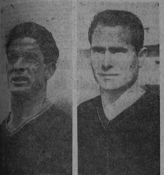
Los veintidós seleccionados de la selección española en su primer partido del domingo frente a Estados Unidos

Los veintidós seleccionados realizaron ayer un partido de entrenamiento. Hoy saldrán en avión para Curitiba