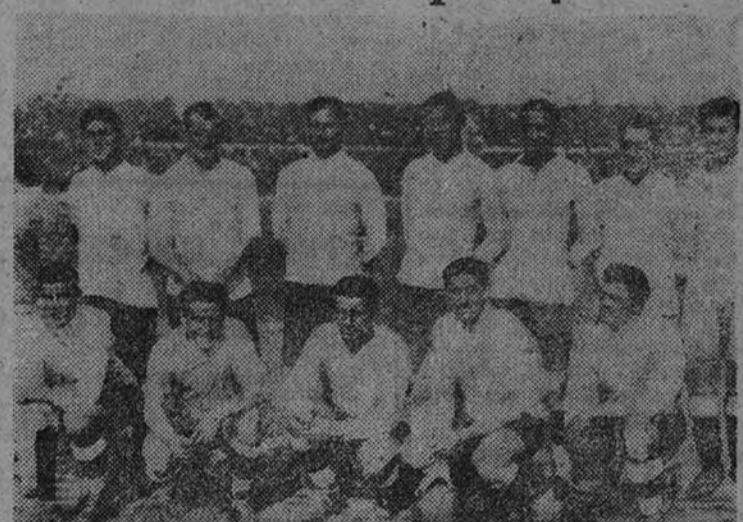
La selección nacional de Uruguay, vencedora en el I Campeonato del Mundo de Fútbol, jugado en Montevideo el año 1930

¿Cómo no participó España? Es una pregunta que no la contestamos ahora. Tenía entonces un gran equipo, uno que, como se recordará, venció a los italianos en el Littorale de Bolonia. A. KARG