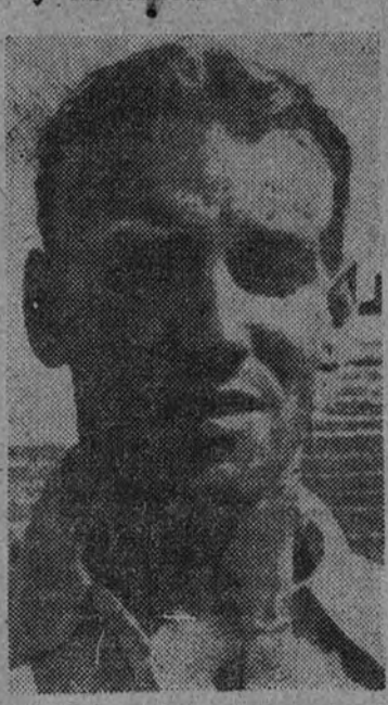
La falta de Carlsson y Nordahl en la delantera sueca, restará mucha potencia al equipo, según los aficionados de esa nación

Por faltar en su equipo Nordahl, Carlsson y Mathjiensen