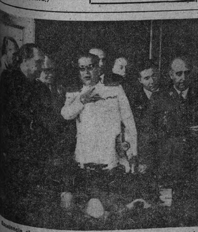
Excmo. el Jefe del Estado, acompañado de varios Ministros del Gobierno y otras personalidades, durante su visita a las instalaciones de la Unión Química del Norte de España. (Foto Cifra.)

El Valle de Escombreras tiene ya su primer habitante de hecho Se nació una niña en el pueblo de Escombreras. —En el nuevo, poblado del Valle de Escombreras se ha producido el primer nacimiento de una niña, hija del matrimonio de la familia de don Torres. (Cifra.)