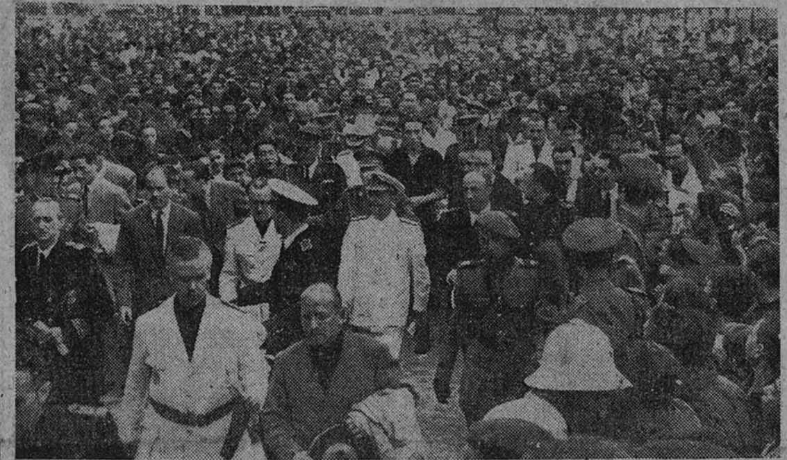
El Caudillo durante su visita a la nueva barriada

En su última jornada en Bilbao, Franco inauguró la nueva estación de la Renfe y la gigantesca barriada de San Ignacio de Loyola. RAIMUNDO FERNANDEZ-CUESTA PUSO DE RELIEVE LA INFLUENCIA DE LA FALANGE EN EL RENACIMIENTO DE ESPAÑA