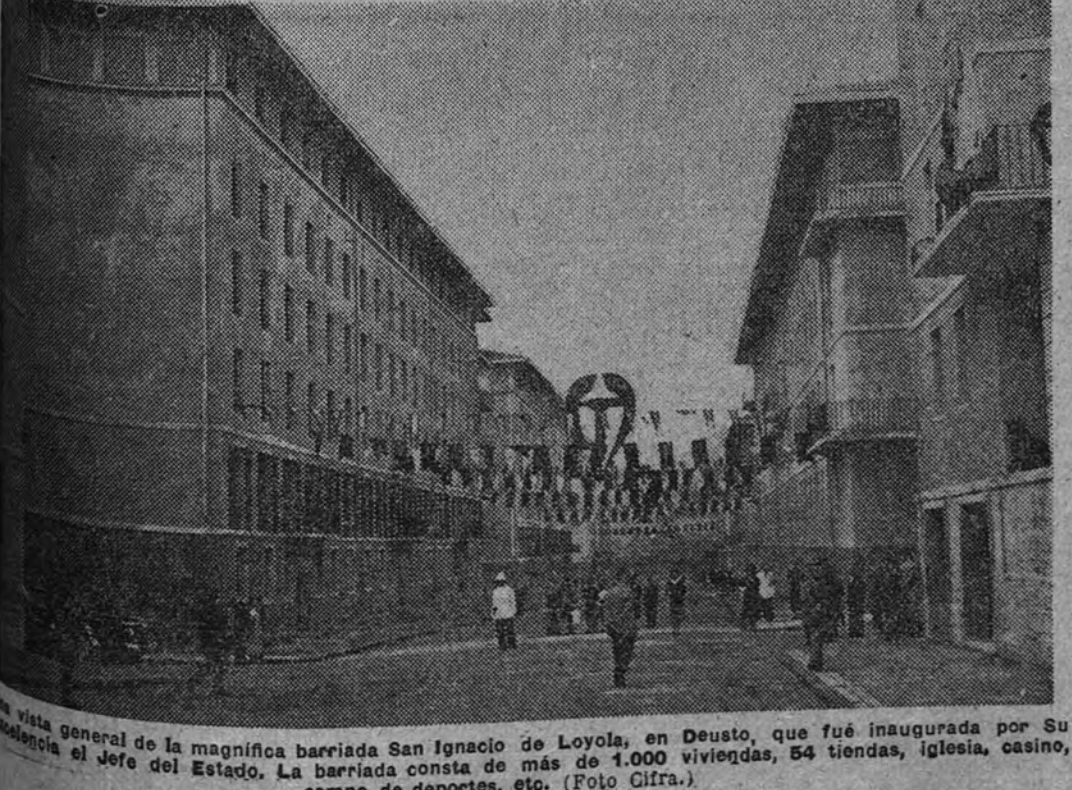
El Jefe del Estado en la magnífica barriada San Ignacio de Loyola, en Deusto, que fue inaugurada por Su Excelencia el Jefe del Estado. La barriada consta de más de 1.000 viviendas, 54 tiendas, iglesia, casino, campo de deportes, etc.