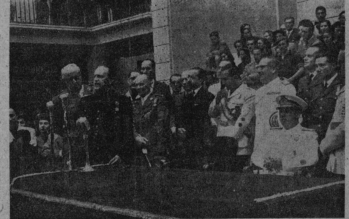
El Ministro y Secretario General del Movimiento, camarada Fernández-Cuesta, en un momento del discurso que pronunció en Deusto, con motivo de la inauguración y bendición de la nueva barriada de San Ignacio