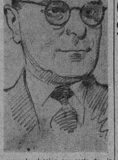
que la elección por parte de la Academia Española de Rafael Lapesa para una plaza de número es un hecho de gran importancia en la vida española, ya que incorpora a la venerable institución servidora de nuestro idioma a uno de sus mejores conocedores.