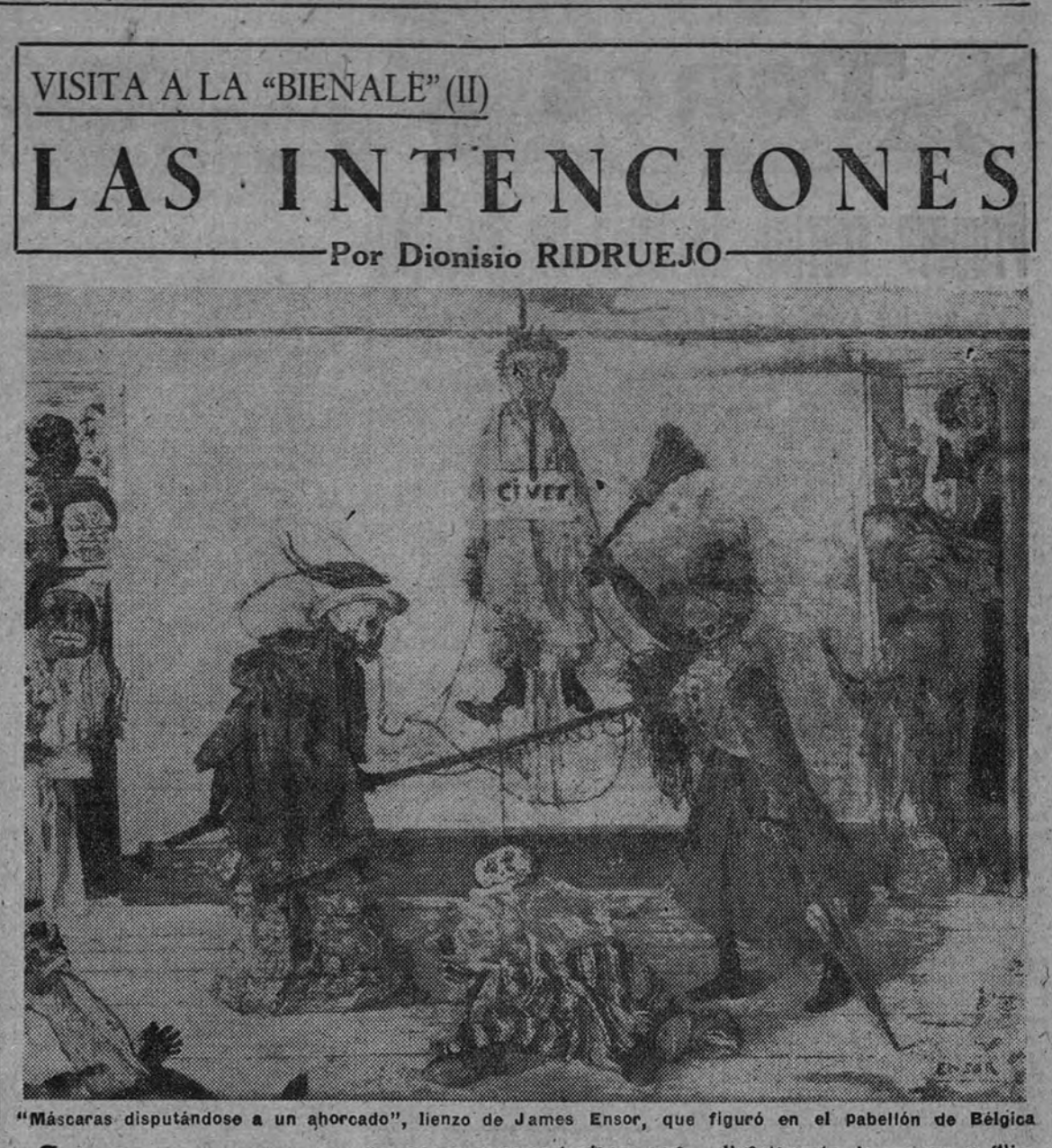
"Máscaras disputándose a un ahorcado", lienzo de James Ensor, que figuró en el pabellón de Bélgica

NOVISIMO GLOSARIO INSPIRACIONES DE LA MAÑANA A LAS SIETE (ANTE UNOS POSTIGOS CERRADOS) ¡Bendita la jornada, que empieza, como el vivir del hombre, en la oscuridad; que, a estilo de la tarea del trabajador, culmina en la meridiana gloria de la luz; que termina, así en una capilla ardiente, entre luces! A LAS NUEVE (ANTE UN PERIÓDICO) ¡Cuánto se parece el retrato del ministro Robert Schuman a las viejas caricaturas de las «Lustige Blaetter»! A LAS ONCE (ANTE UN CACHARRO CON FRUTAS) En el terrón de arcilla, hay dos posibilidades: la de abrigar una semilla o la de performarse en ánfora. La rica materia sirve a la obra de la natura; la bella forma, a la del espíritu. De la primera, el hombre vive; en la segunda, pervive. Una tiene el porvenir del Padre; otra, el del Angel. Eugenio d'ORS