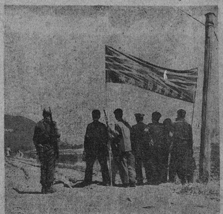
Este es el paralelo 38, frontera entre la Corea del Norte y la del Sur, que ha sido cruzada por los comunistas, dando lugar al actual conflicto

Los ex combatientes franceses han ocupado la plaza de la Opera de París. En tiendas de campaña, los viejos soldados de la primera guerra mundial y los de la última se han instalado en tiendas de campaña en dicho lugar para protestar de las exiguas pensiones que reciben. (Efe.)