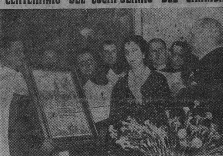
La esposa de Su Excelencia el jefe del Estado, doña Carmen Polo de Franco, recibida a la Junta Nacional del VII Centenario del Escapulario del Carmen, presidida por don Esteban Bilbao, que le hizo entrega de un pergamino en el que figura el nombramiento de presidentes de honor de dicha Junta a favor del Caudillo y su esposa