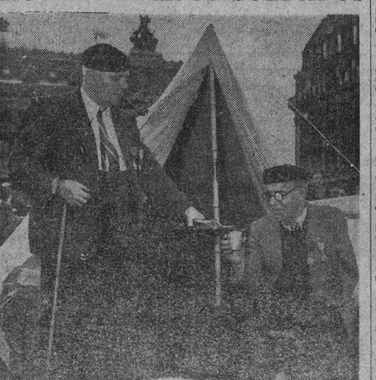
Los ex combatientes franceses han ocupado la plaza de la Opera de París. En tiendas de campaña, los viejos soldados de la primera guerra mundial y los de la última se han instalado en tiendas de campaña en dicho lugar para protestar de las exiguas pensiones que reciben.