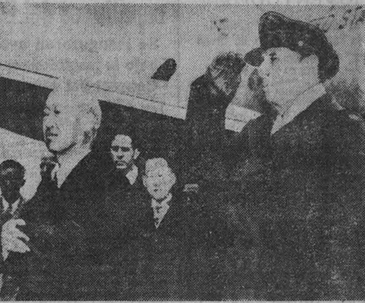
El general Mac Arthur, jefe de las fuerzas norteamericanas en el Extremo Oriente, es recibido en el aeródromo de Guxun por el Presidente Rhee de Corea, con quien sostuvo una larga conferencia para estudiar la situación creada por la invasión roja.

En un largo mensaje redactado en ruso anuncia a la O. N. U. que seguirá luchando Chan Kai Chek pide a las Naciones Unidas que califiquen a Rusia de agresora