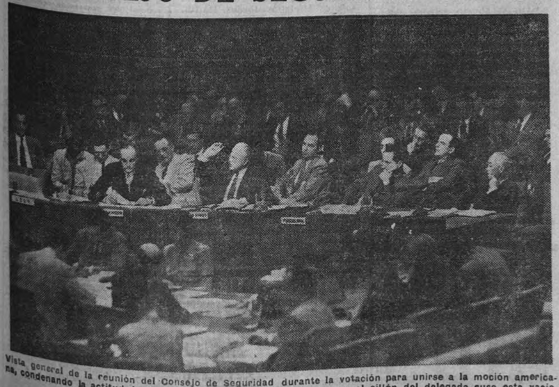
Vista general de la reunión del Consejo de Seguridad durante la votación para unirse a la moción americana, condenando la actitud de Corea del Sur. Como puede observarse, el sillón del delegado ruso está vacío. Es natural.

EL DIA 12, PLENO DE LAS CORTES. El "Boletín Oficial del Estado" publica, entre otras, la siguiente disposición: PRESIDENCIA DE LAS CORTES. Convocando al Pleno de las Cortes Españolas para la sesión que se celebrará el próximo día 12 de julio, a las cuatro y media de la tarde.