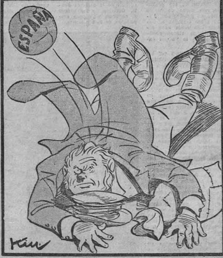
—¡Nada! ¡Que nos hemos caído con todo el "equipo"!

Será efectuado hoy o mañana. RIO DE JANEIRO.—Los cuatro equipos que se han clasificado para las finales de la actual competición esperan el sorteo, que determinará la forma en que habrán de enfrentarse los citados conjuntos, así como las fechas de los partidos. Se espera que el sorteo se efectúe en este capital el martes o miércoles próximo. Cada uno de los cuatro equipos finalistas, es decir, España, Suecia, Brasil y Uruguay, jugará con los tres restantes, resultando así un total de seis partidos, y el que obtenga mayor número de puntos, será proclamado campeón mundial de 1950. En caso de empate en puntos habrá de jugarse un nuevo partido de desempate. Los jugadores españoles, brasileños y suecos se encuentran en Río de Janeiro. Se espera que los uruguayos lleguen esta noche de Belo Horizonte. El martes reanudarán su preparación los uruguayos. Los brasileños se entrenaron hoy, y su preparador, Juvêncio Costa, está decidido a preparar el equipo con el máximo cuidado para no frustrar las esperanzas de los millones de aficionados brasileños, de esos de lograr el máximo título futbolístico. Por el momento, no hay seguridad de que se puedan jugar todos los partidos de la serie final en Río de Janeiro, como se había pensado en un principio. Es posible que alguno de los encuentros haya de celebrarse en el estadio de Pacembu, de São Paulo. (Efe.)