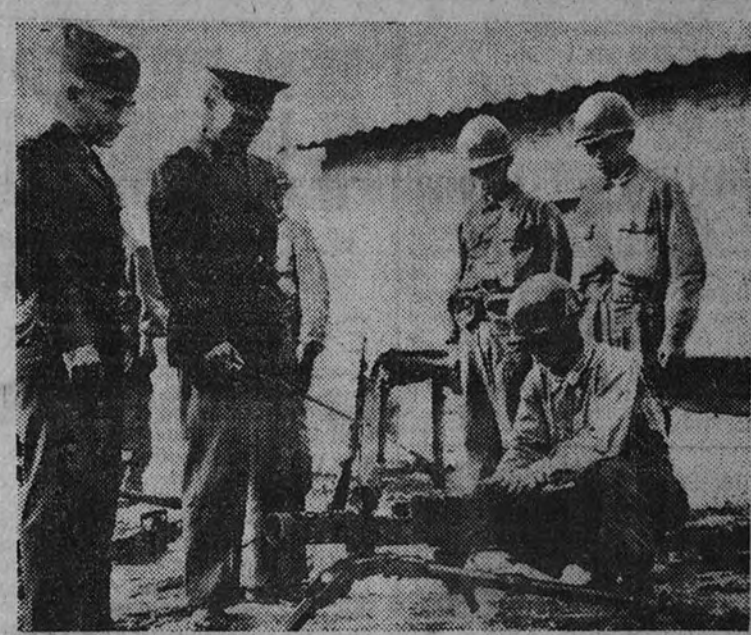
Un teniente norteamericano destinado en Corea instruye sobre el uso de un fusil "Bazooka" a algunos soldados coreanos que se disponen a defender la integridad de su patria. (Foto Ortiz.)

La Marina ha continuado sus servicios de patrulla por la costa.» (Efe.)