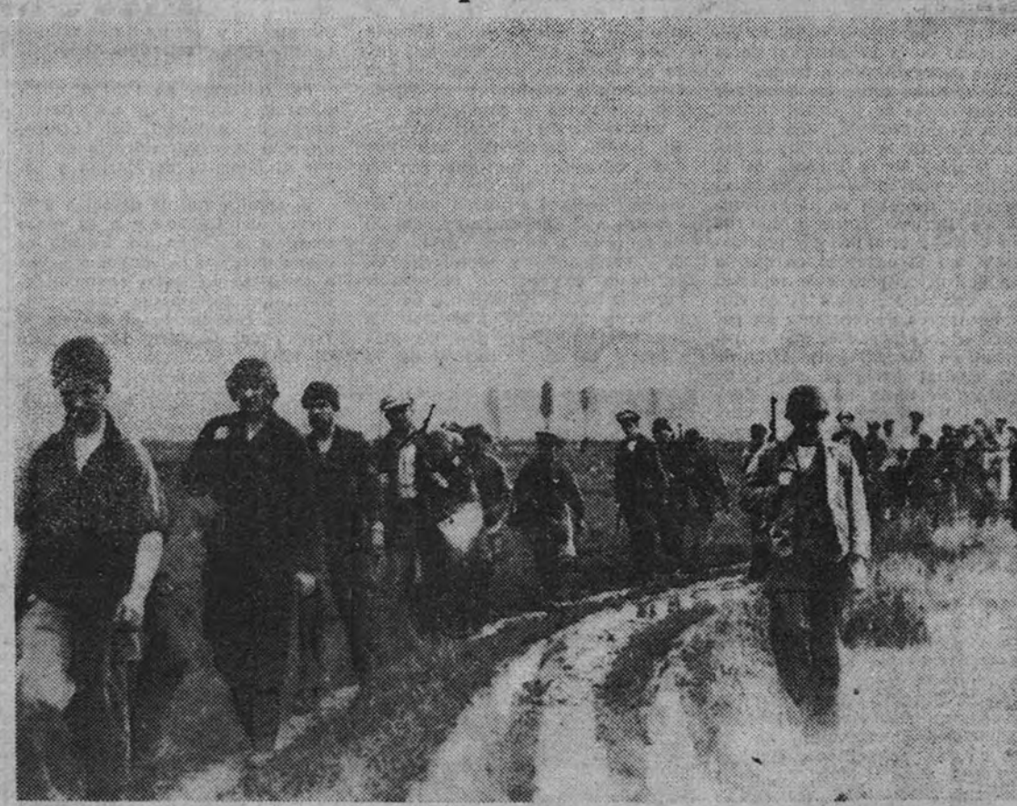
Miembros del grupo asesor militar yanqui en Corea, dirigiéndose hacia el río Han, camino de Guxon, donde fueron evacuados al Japón, ante el avance rojo.