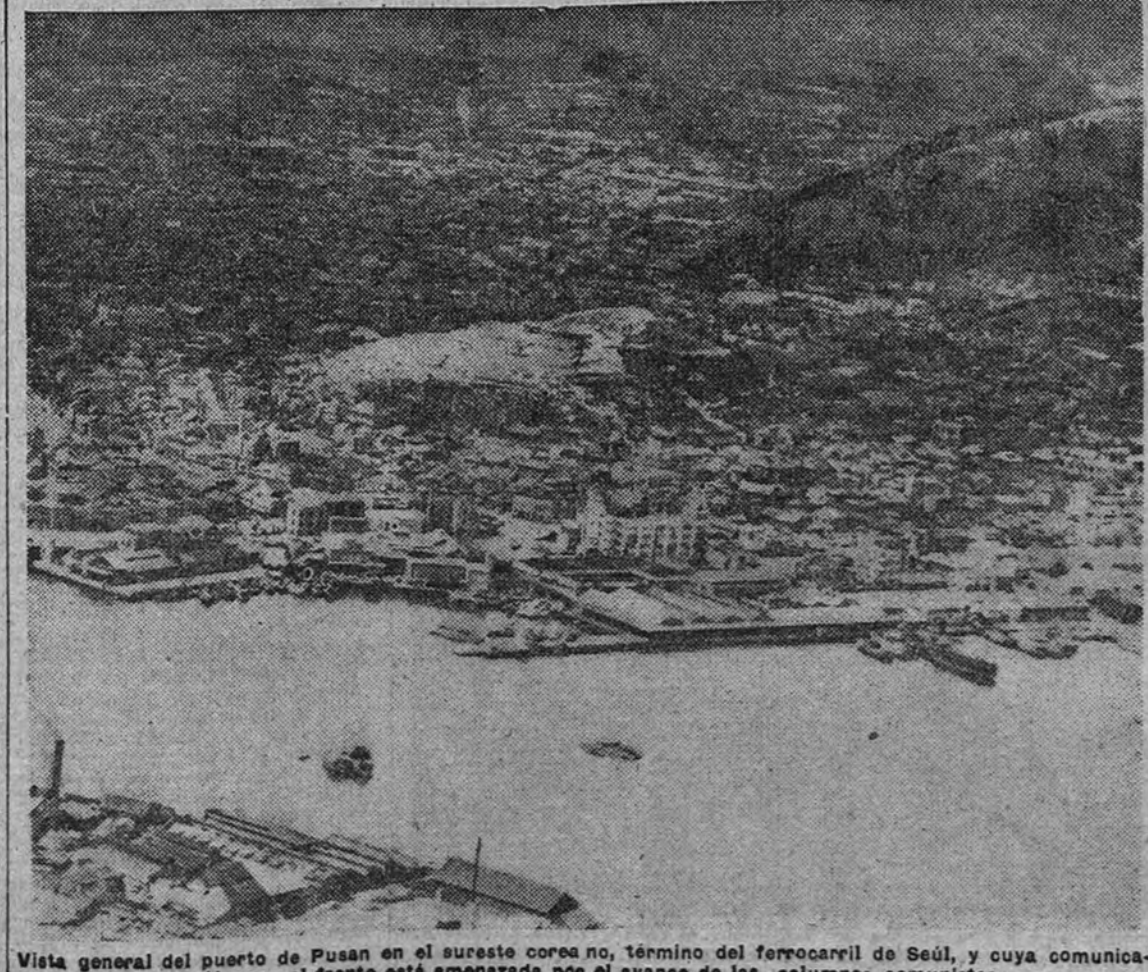
Vista general del puerto de Pusan en el sureste coreano, término del ferrocarril de Seul, y cuya comunicación con el frente está amenazada por el avance de las columnas comunistas

Nos corresponde destacar una apreciable coincidencia que viene a ponderar un acuerdo del Consejo de Ministros por el que se encomienda al Instituto Nacional de la Vivienda la construcción de dos mil viviendas protegidas en el suburbio de Carabanchel Alto (Madrid). Por una parte, esta significativa acción de Gobierno practica una en nuestra información local, exponiendo las líneas de mejor resultado urbano de Madrid, acción de Gobierno aplicada en gracia a la canalización de la Navegación y la urbanización del Manzanares. Por otra parte, el problema de la habitación en el suburbio de Carabanchel Alto, especialmente de hoy, recibe la réplica promesa del Instituto Nacional de la Vivienda, cuya actitud análoga en la información expresada en la información que puede considerarse, que no puede ser limitada por completo desde el momento de la acción municipal, su reconocimiento con la acción de Gobierno muestra de la atención que presta a la dotación de viviendas dignas a las clases mo-