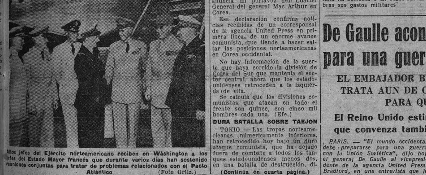
Alto jefe del Ejército norteamericano reciben en Washington a los altos jefes del Estado Mayor francés que durante varios días han sostenido reuniones conjuntas para tratar de problemas relacionados con el Pacto Atlántico

ALUD DE COMUNISTAS TOKIO. — Un alud de tropas comunistas, en las que figuran veteranos de los ejércitos rojos de China y Manchuria, y que llevan consigo ochenta tanques, han atacado la línea defensiva de los norteamericanos y han rechazado a éstos hacia el sur, a nuevas posiciones preparadas de antemano, anuncia un portavoz del Cuartel General del general Mac Arthur en Corea.