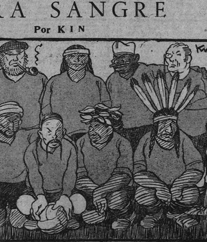
La futura "selección nacional" cuando se haga a base de los equinos mediterráneos