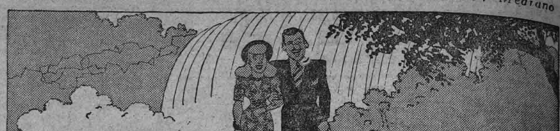
LUNA DE MIEL