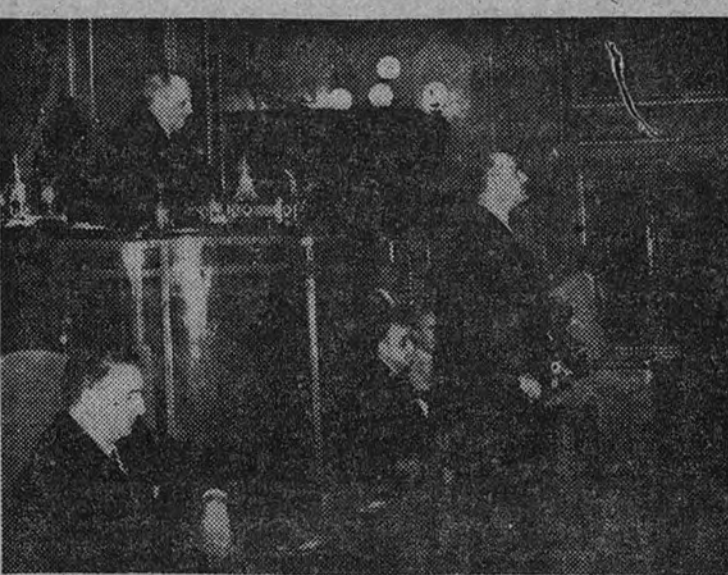
El Ministro de la Gobernación, durante su discurso

Aunque reconocamos una superior jerarquía a la Medicina preventiva, vale más prevenir que curar—decimos—; siempre encontraremos a la Medicina asistencial en el primer plano de actualidad. Todos los esfuerzos que se hacen para crear una floreciente sanidad en países que no tienen organizada en el mismo grado la asistencia médica, están condenados a un parcial fracaso, ya que hombres, instituciones y consignaciones presupuestarias se escapan insensiblemente a la Medicina curativa, sencillamente porque les atrae allí la pública demanda. Este concepto unificado de la Medicina