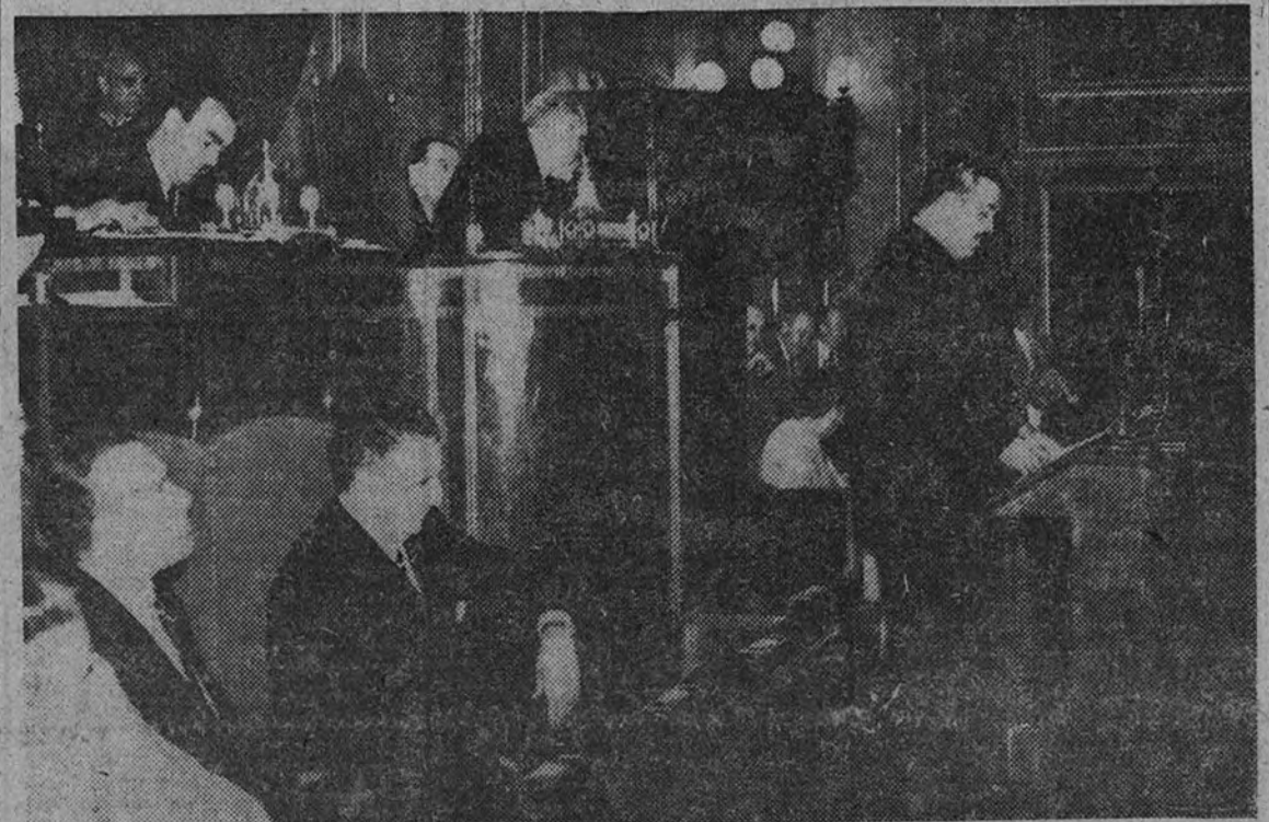
El Ministro de Trabajo durante el discurso que pro nunció ayer ante el Pleno de las Cortes

La política sanitaria del Régimen ha situado a nuestra Patria entre las primeras naciones de más bajo nivel de mortalidad, expuso el Ministro de la Gobernación