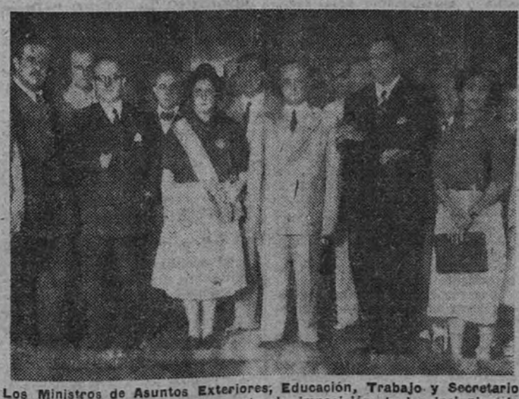
Los Ministros de Asuntos Exteriores, Educación, Trabajo y Secretario General del Movimiento, en el acto de imposición de las insignias de la Gran Cruz de Isabel la Católica a Pilar Primo de Rivera

Se pone en conocimiento de todos los ex combatientes de la gloriosa División Azul que desean adherirse a los actos que día 14 de julio, como fecha conmemorativa de su partida al frente ruso, pueden acudir a Jilense, siendo el lugar de reunión para los mismos a las once de la mañana en la plaza del Ayuntamiento.